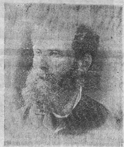
Antero de Quental

actividades sin límites del péndulo de esta parte de su vida. Entre luchas y desmayos su figura se agiganta. No era sólo la inteligencia lo que le daba un lugar preeminente, sino su carácter y grandeza de alma. "El desprendimiento por todos los intereses mundanos, el amor a la justicia, el ideal del bien y de la verdad le convertían en un ser superior."