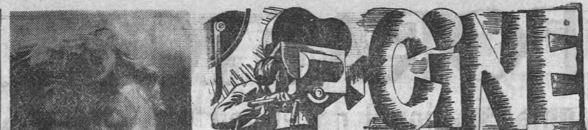
Jorge Negrete, el gran cantante de la pantalla, reaparece hoy en los cines Gran Vía y Vergara con la película "El rebelde".

LONDRES 6.—En los medios bien informados se cree conocer el texto de la nota verbal que el pasado domingo presentó en el Foreign Office, en nombre del Estado español, el embajador de España, señor Bárcenas, y que se dice es del tenor siguiente: «Ante el anuncio reiterado por la Prensa y radio de ese país de una nota conjunta de los Gobiernos de Estados Unidos, Gran Bretaña y Francia sobre la situación española, y en el caso de ser cierto que en ella se contiene una comunicación a España para que cambie su régimen político, el Gobierno español desea hacer saber por adelantado a ese Gobierno que, cualquiera que sean las intimidaciones que reciba del extranjero, España las rechaza, por consideración de su soberanía política, cuestión de su régimen político. Un acto más del extranjero que independencia amenaza a nuestra independencia política, en la integridad de su soberanía, estando, por tanto, el Gobierno seguro de que en esta actitud de repulsa le acompaña unánime la opinión nacional. Además, al proceder así, España está cierta de que presta un positivo servicio a la comunidad internacional defendiendo el principio de mutuo respeto que es fundamento de su existencia. (Efe.)