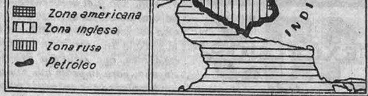
Las zonas de ocupación según el tratado de 1907

Es casi imposible trazar, en estos momentos de pasión y de desbordamiento informativo, un cuadro histórico de la crisis persa y de la evolución de este problema mundial desde la ocupación del país por las fuerzas aliadas tripartitas —inglesas, rusas y americanas— en 1942. Se convino entonces un sistema de ocupación en tres zonas, la del Norte ocupada por los rusos, cuya evacuación debía realizarse a los seis meses de concluidas las hostilidades. Como precedente, bastante lejano, de esta actitud de países que seguían siendo oficialmente amigos de Persia, existía el tratado de 1907, que delimitó las zonas respectivas de influencia de Inglaterra y de Rusia. No debe olvidarse, al hacer un estudio de esta cuestión, que Persia cumple función de "país frontera" entre Rusia y los dominios de Inglaterra en Oriente y que su riqueza petrolífera ha convertido a este país, desde comienzos de siglo, en escenario de la rivalidad de las grandes Compañías, tras las cuales se adivina oculta la mano de los más poderosos Estados de la tierra.