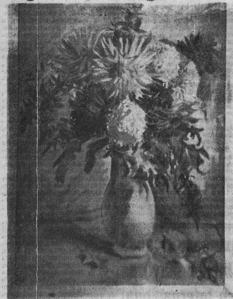
Uno de los cuadros presentados por el artista argentino Jorge Larco

En el grupo de pintores argentinos incorporados a los movimientos de vanguardia, el postimpresionismo sitúa a Jorge Larco, cuya obra de acuarela y dibujo figura expuesta actualmente en los salones del Museo Nacional de Arte Moderno. Tal filiación se halla condicionada en Jorge Larco por una sensibilidad profunda de las cosas, en términos de la más amplia reacción sensible, que favorece la diversidad de formas y expresiones sin destruir la unidad de estilo. La inclinación eclectica del artista, un tanto entorpecida por la voluntad de definición, no llega a estimularse suficientemente en la noble inquietud creadora, ajena en este caso a todo amaneramiento y formalismo. Huye el pintor argentino del confinamiento expresivo, no obstante la probada eficacia de sus recursos técnicos en el tratamiento de la acuarela. Y aun en el orden temático su dibujo espiritual encuentra el cauce propio en el tratamiento de los distintos géneros. Desde el bodegón, resuelto con un sentido de objetividad estricto, hasta el paisaje de expresividad ligera y sintética, impregnado de gracia "fauve"—aludimos a la manera, no al color—, en el que Larco se desentiende de toda preocupación verista.