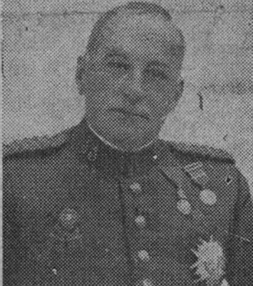
General Primo de Rivera

cuál iban el obispo auxiliar de Valencia y monseñor Vizearra. Por otra parte, conozco y admito, como todos los católicos cubanos, el magnífico espíritu y temple español. —¿Hay muchos religiosos españoles en Cuba? —Muchos, y hacen mucho bien en las almas. Suplen, por otra parte, la escasez de clero que hay todavía en nuestra República. En mi archidiócesis el número de sacerdotes es muy corto, y lo mismo se puede decir del arzobispado de Santiago de Cuba y las otras cuatro diócesis que hay en la isla. —¿Es esperanzador el porvenir del catolicismo en su país? (Continúa en cuarta página.)