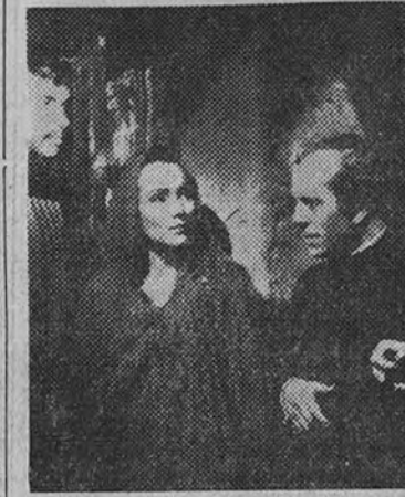
He aquí una escena de «Maria Candelaria», la gran creación de Dolores del Río que el lunes se estrenará en los cines Gran Via y Vergara

LUNES PROXIMO SENSACIONAL ESTRENO Ango del CARRIL y AMANDA LEDESMA LA NOVELA de un JOVEN pobre... DISTRIBUCION CHAMARTIN Basado en la obra del mismo título, de Octavio Feuillet (485 P)