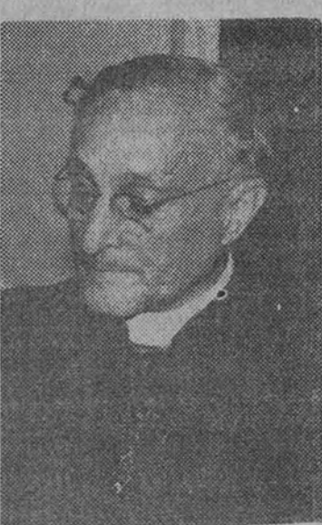
Monseñor Arteaga Betancourt

cuál iban el obispo auxiliar de Valencia y monseñor Vizearra. Por otra parte, conozco y admito, como todos los católicos cubanos, el magnífico espíritu y temple español. —¿Hay muchos religiosos españoles en Cuba? —Muchos, y hacen mucho bien en las almas. Suplen, por otra parte, la escasez de clero que hay todavía en nuestra República. En mi archidiócesis el número de sacerdotes es muy corto, y lo mismo se puede decir del arzobispado de Santiago de Cuba y las otras cuatro diócesis que hay en la isla. —¿Es esperanzador el porvenir del catolicismo en su país? (Continúa en cuarta página.)