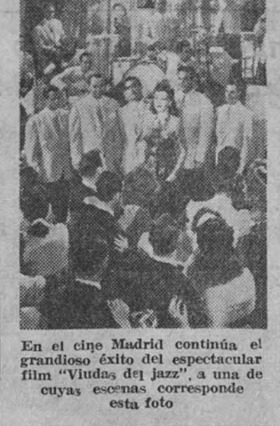
En el cine Madrid continúa el grandioso éxito del espectacular film «Vidas del jazz», a una de cuyas escenas corresponde esta foto (485 A)