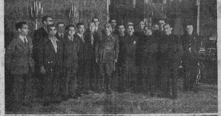
LOS MINEROS, CON EL CAUDILLO

Su Excelencia agradeció esta prueba de adhesión, exhortándoles a seguir laborando por el engrandecimiento de la patria.