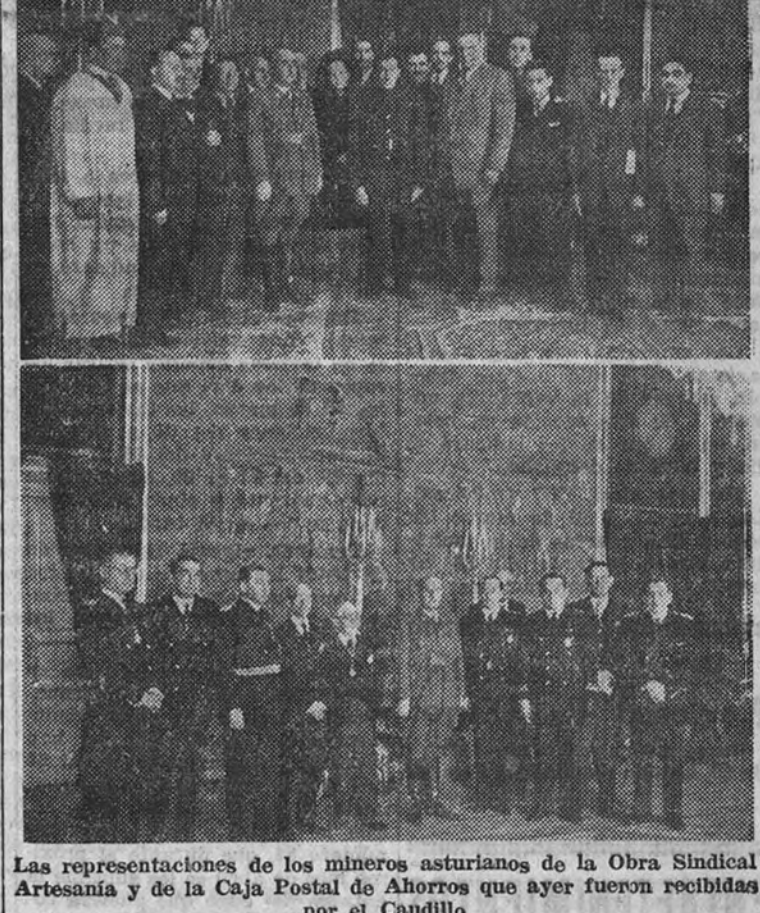
Las representaciones de los mineros asturianos de la Obra Sindical de Artesanía y de la Caja Postal de Ahorros que ayer fueron recibidas por el Caudillo

En el día de ayer, y en el Palacio de El Pardo, Su Excelencia el Jefe