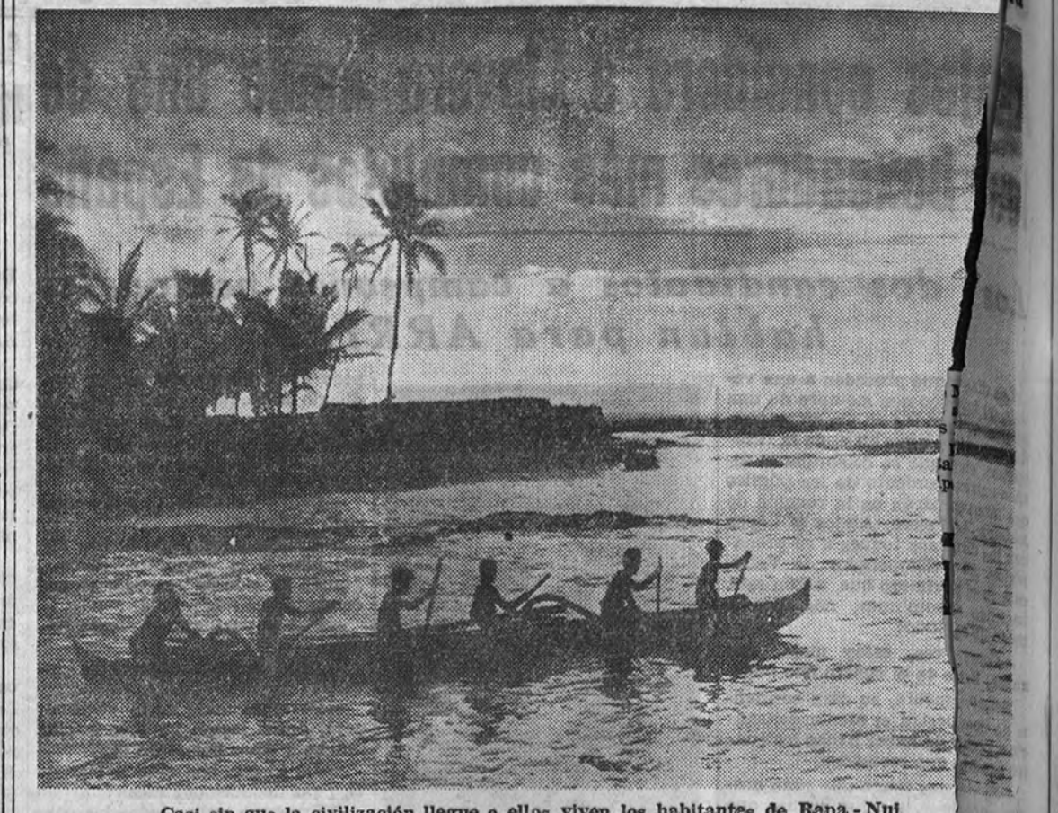
Casi sin que la civilización llegue a ellos viven los habitantes de Rapa-Nui

La isla de Pascua, testimonio de una civilización antiquísima