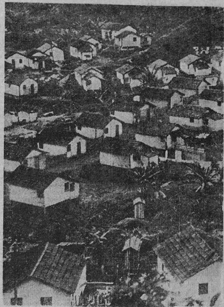
Un barrio de la ciudad de Curupaiti, donde viven cuarenta mil leproso

Allí han encontrado su paraíso terrenal los atacados de este inmenso mal. En su ciudad no se saben tan solos; nadie se aparta de ellos, porque todos sufren idéntica condena. Es la suya una auténtica hermandad maravillosa, que les une con nexo indisoluble al mismo yugo del común martirio. Este mundo aparte—cuya contemplación nos daría horror, y para ellos es remanso de felicidad—no tiene con el mundo otra comunicación que la que le proporciona cincuenta y dos aparatos de radio, estratégicamente distribuidos por la población. Hubo un tiempo en que los leproso recibían la Prensa de Río; pero, sin duda, a la vista de las cosas que en el mundo sucedían, acordaron unánimemente prohibir la entrada