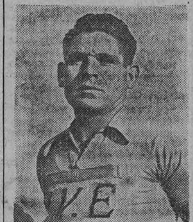
Gual venció en el Trofeo Masferrer. Entraron juntos veinticinco corredores en Montjuich

Se esperan nuevas inscripciones de otras destacadas figuras del ciclismo. (Mencheta.)