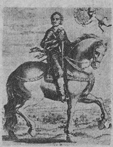
Juan IV de Portugal

Ofrece a continuación el príncipe depositar cada año en el santuario de la Virgen en Villaviciosa cincuenta cruzados de oro, en señal de tributo y vasallaje, legando a sus sucesores y a su pueblo la obligación de cum-