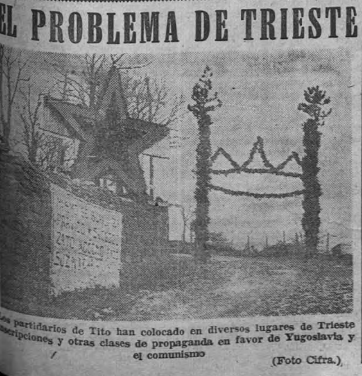
Los partidarios de Tito han colocado en diversos lugares de Trieste inscripciones y otras clases de propaganda en favor de Yugoslavia y el comunismo