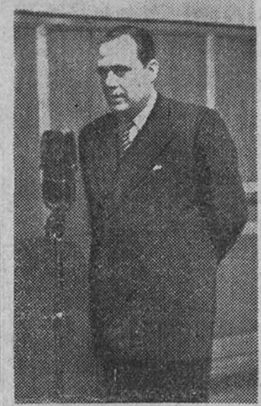
El Subsecretario de Educación Popular, ante el micrófono de Radio Nacional durante el pregon de la Semana Santa sevillana.

Del éxito de este programa extraordinario puede dar idea el elevado número de llamadas telefónicas de felicitación recibidas en Radio Nacional de España. Ante estas llamadas y otras de numerosos radioyentes que por no haber