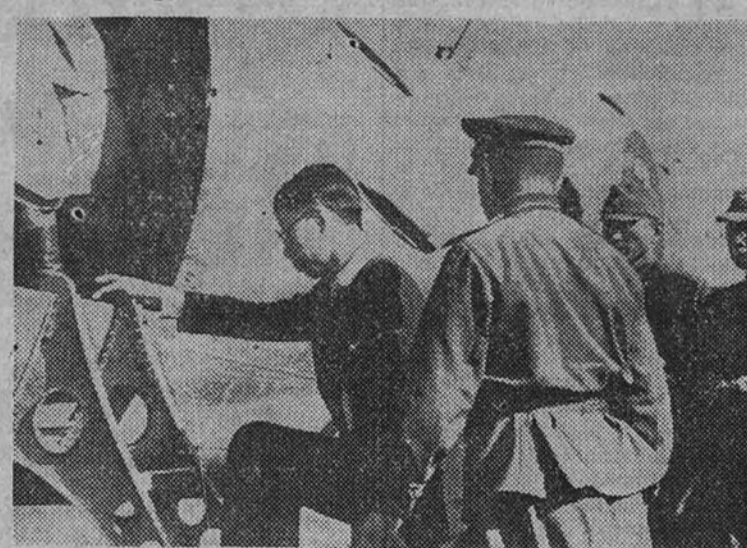
El Emperador del Manchukuo, Pu-Yi, detenido por los rusos, sube al avión que había de conducirle a una prisión en el interior de Rusia

Nuevamente viene al plano de la actualidad internacional. El Emperador del desaparecido Manchukuo, Pu Yi, que en su niñez ocupó el Trono de China, será en breve entregado por las autoridades rusas, que lo tienen en una prisión siberiana, al Gobierno central chino, con el fin de que se le instruya el proceso. (Efe.)