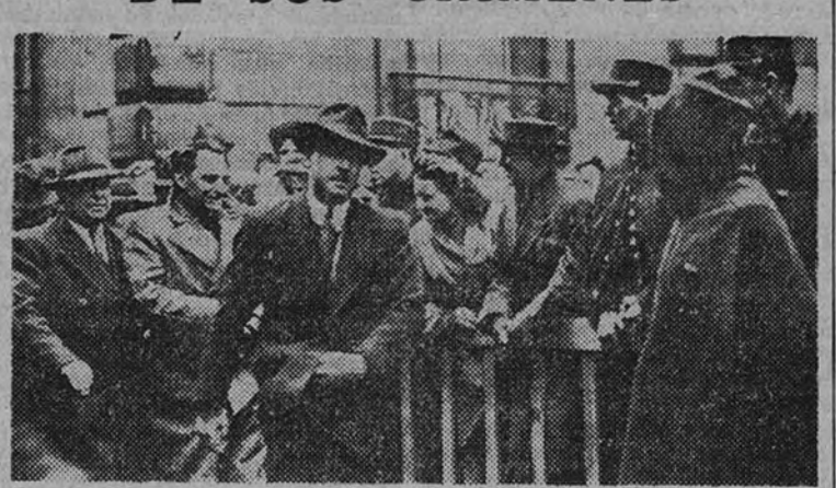
El doctor Petiot a su llegada, conducido por la Policía, a su hotel de la calle de Lesueur, para la diligencia de reconstrucción, fué recibido por una multitud de curiosos, a los que únicamente sonreía. Después, ante la "cámara de la muerte" el "héroe de la Resistencia" se desmayó.