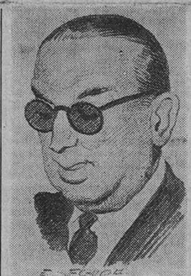
Ghavam es Sultaneh

Ghavam Sultaneh fué nombrado primer ministro en el mes de enero del presente año, después de una vida política verdaderamente tempestuosa, que le ha llevado des-