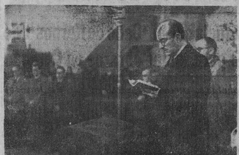
El Ministro de Educación Nacional preside la fiesta religiosa de San Isidro

Las bases de trabajo de la Enseñanza Privada, el paro de licenciados y otras importantes cuestiones han sido examinadas