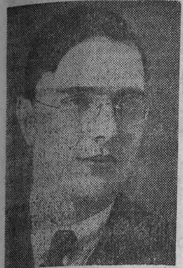
Max Euwe arrebató a Alekhine el título mundial, que volvió a perder frente al malogrado maestro

El título de campeón del mundo es el primordial asunto que debe tratarse en el Pleno