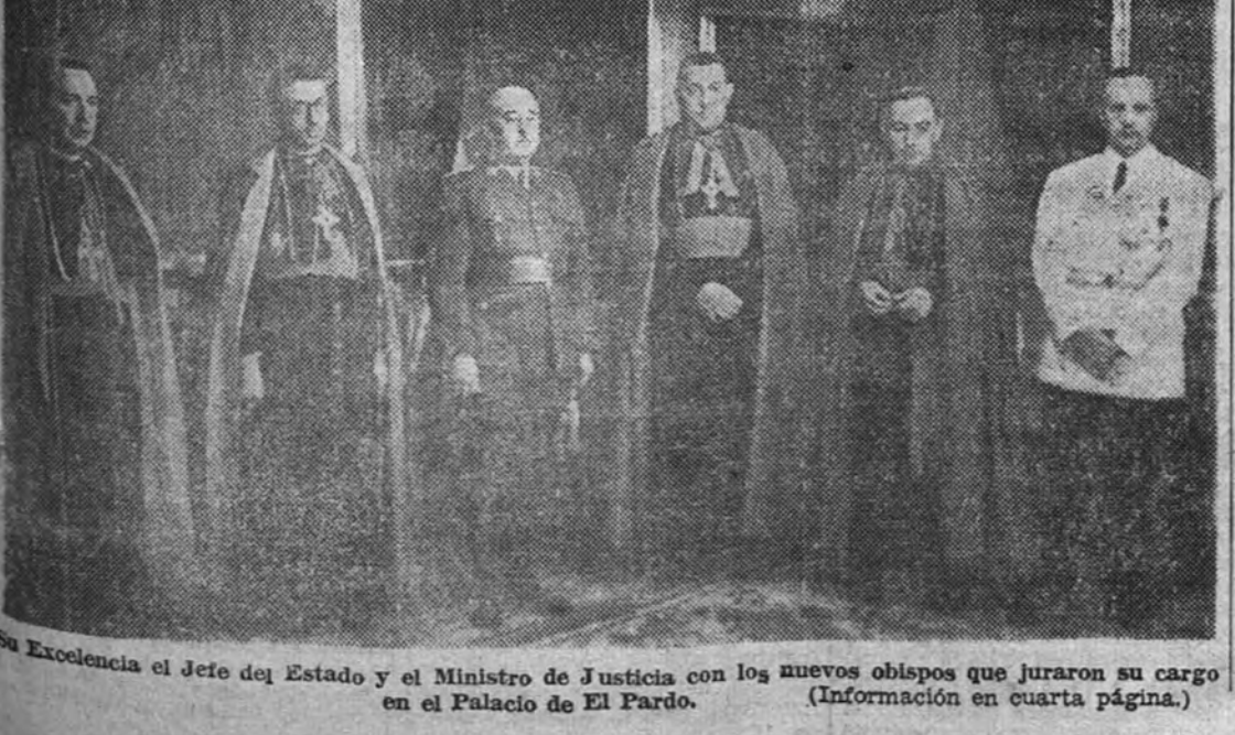
En Excelencia el Jefe del Estado y el Ministro de Justicia con los nuevos obispos que juraron su cargo en el Palacio de El Pardo. (Información en cuarta página.)

Al acto, celebrado en el Palacio de El Pardo, asistió como notario mayor el Ministro de Justicia