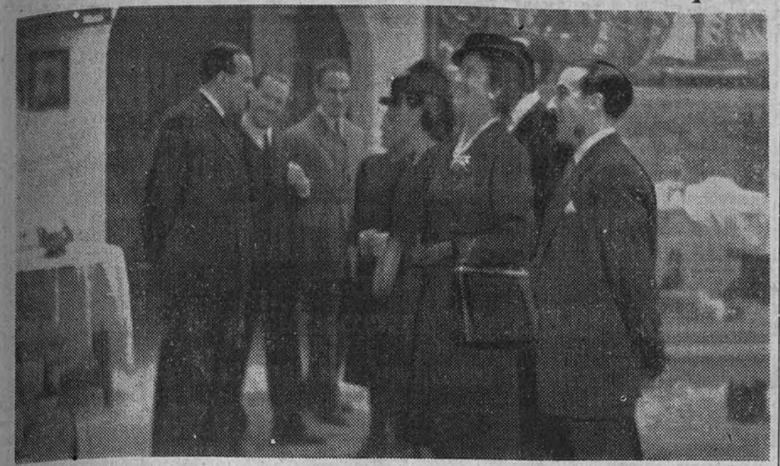
La esposa del Caudillo, el Vicesecretario General del Movimiento, el Delegado Nacional de Sindicatos y otras personalidades.

Fué recibida por el Vicesecretario General del Movimiento, el Delegado Nacional de Sindicatos y otras jerarquías