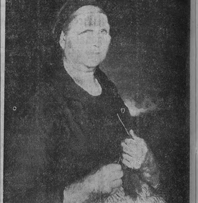
«Campesina», una de las obras que figuran en la Exposición que el insigne pintor Alvarez de Sotomayor celebra en Barcelona con un éxito extraordinario de crítica y público