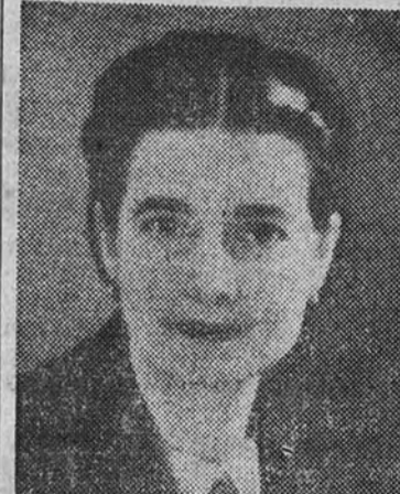
La esposa de Petiot

Primer relato completo de la historia y crímenes del doctor Petiot, inédito hasta ahora en España