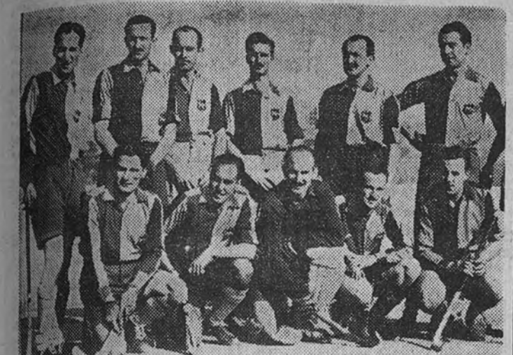
El Barcelona, vencedor en el torneo preliminar del Campeonato de hockey, tiene en la fase final que enfrentará con el A. Aviación y el Amalbat-Bat

Los equipos valencianos, poco favorecidos en el sorteo