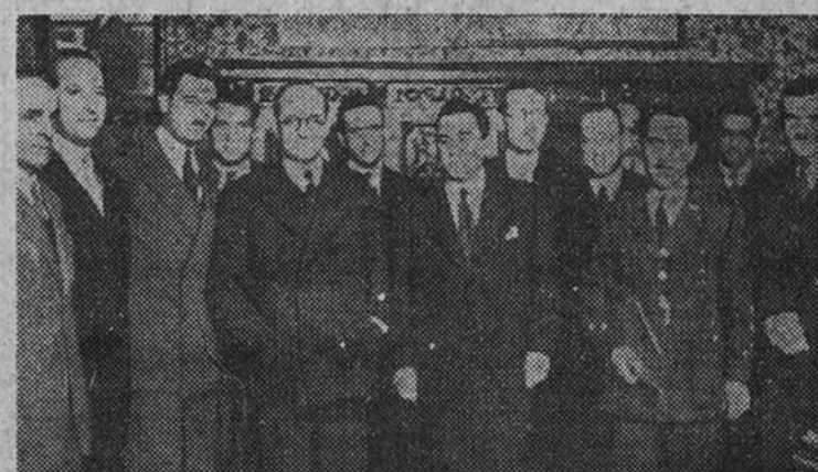
El Ministro de Educación Nacional, acompañado de las personalidades que le visitaron ayer con objeto de hacerle entrega de las conclusiones sobre la Escuela de Periodismo

El señor Ibáñez Martín anunció su propósito de que la escuela funcione ya en el próximo curso