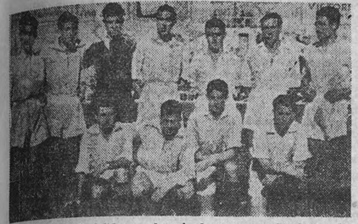
El equipo del Valladolid, que, después de su gran actuación en las primeras fases de la Tercera División, se presenta como uno de los aspirantes más calificados para el ascenso

La igualdad de fuerzas de los cinco participantes dificulta el pronóstico