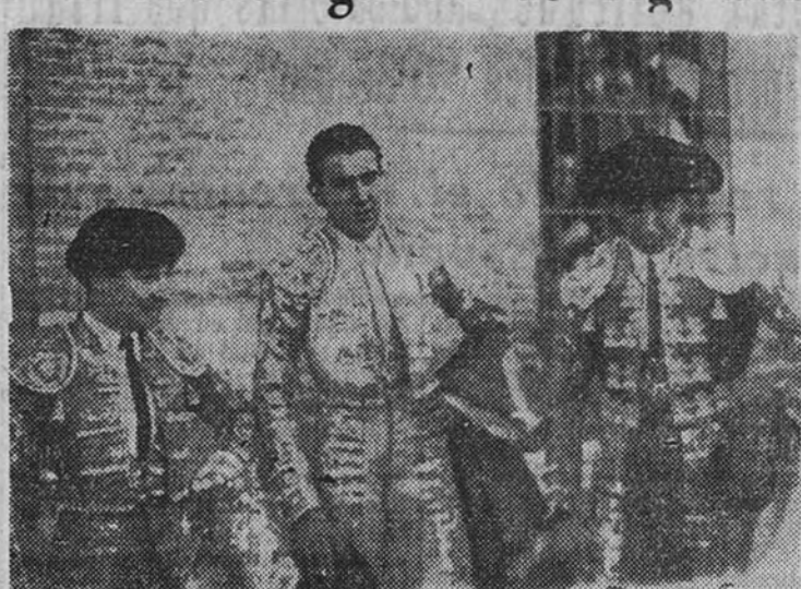
Los tres matadores que inauguraron la plaza de Alcala