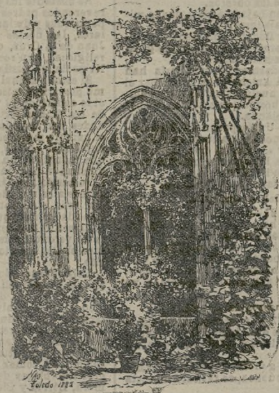
Ventana de San Juan de los Reyes.

Recordar la historia del convento toledano es ya casi pasado. Tantas veces y con tan variados motivos hemos escrito de él en estas mismas columnas.