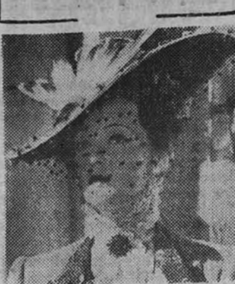
Bette Davis interpreta con Charles Boyer la producción «El cielo y tú», que se estrenará el Sábado de Gloria en el Palacio de la Música