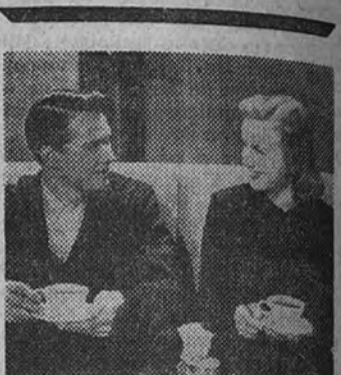
Gene Kelly y Diana Durbin en un diálogo de «Luz en el alma», adaptación de la novela de igual título original de Somerset Maugham. Chamarin anuncia el próximo estreno de esta gran producción

que aparecerá en toda España en el mes de abril