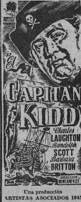
Una producción ARTISTAS ASOCIADOS 1945

«El Capitán Kidd», creación de Charles Laughton, es un film de aventura que apasionará al público del santísimo Palacio de la Prensa a partir del sábado próximo.