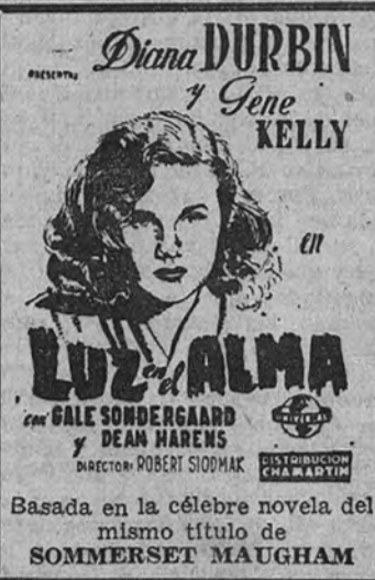
Basada en la célebre novela del mismo título de SOMMERSET MAUGHAM

Para esta fecha memorable en los anales de las novedades cinematográficas, el Palacio de la Prensa anuncia una sensacional película que lleva por título «El Ca-