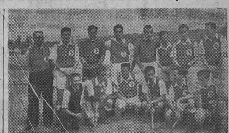
El equipo de hockey del Tarrasa, que al vencer en la final al Atlético queda nuevamente campeón de España