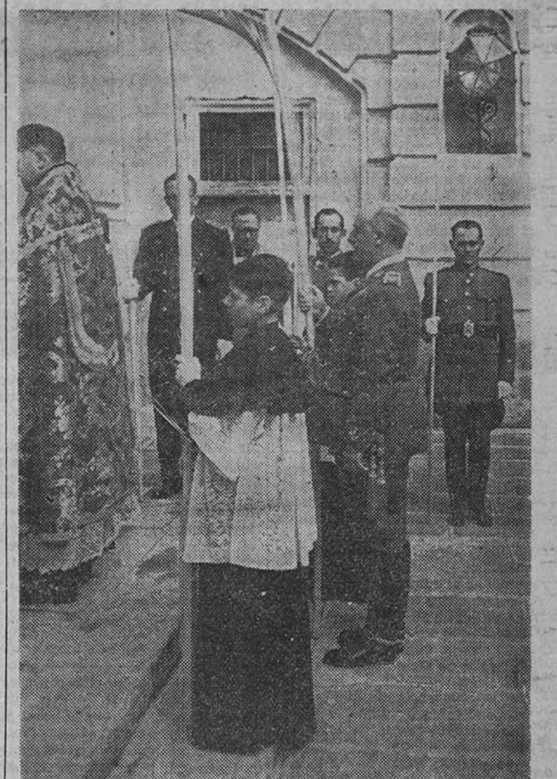
Su Excelencia el Jefe del Estado presidió en la mañana del domingo, junto con su esposa y su hija, la solemne procesión de las palmas celebrada en el Palacio de El Pardo. He aquí al Caudillo en un momento de la procesión del Domingo de Ramos.