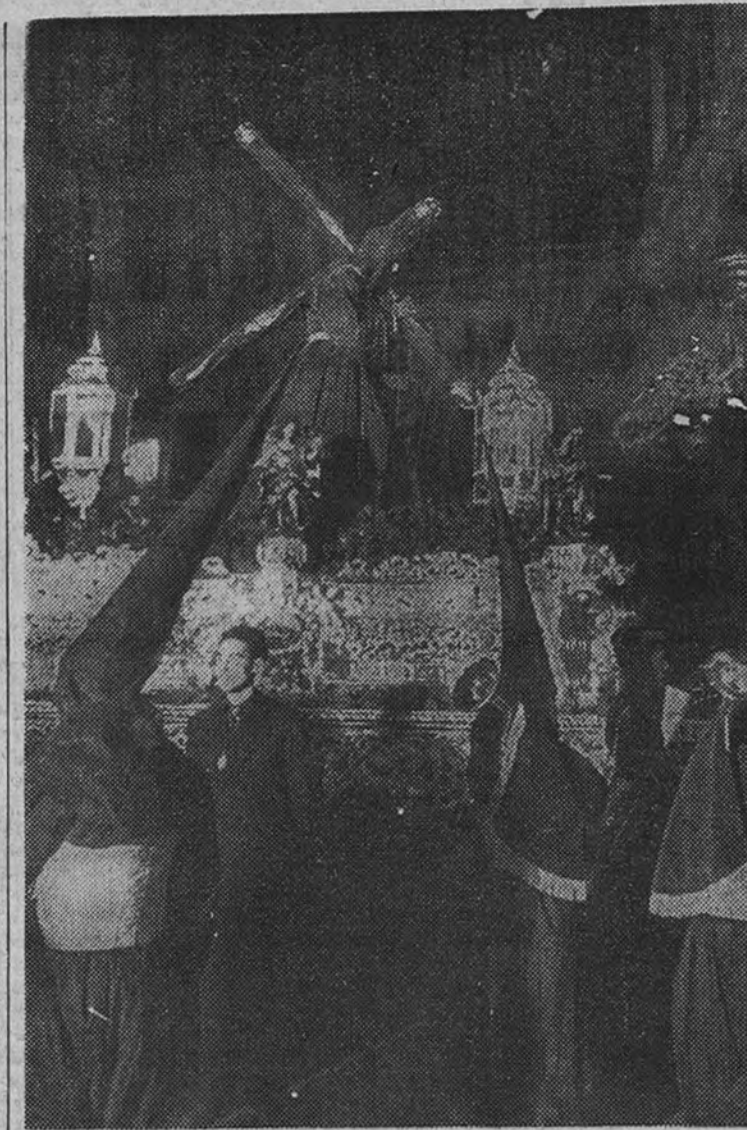
La procesión del Jesús del Gran Poder a su paso por la plaza de la Villa

Al mismo tiempo se hace saber, que la Compañía Telefónica es la única entidad que legalmente está autorizada a editar guías o cualquier otro libro similar que contenga relación de sus abonados con su número de teléfono, por lo que el Anuario citado tiene carácter clandestino, y sus editores habrán de responder ante los Tribunales de los daños o perjuicios que pudieran derivarse de su publicación.