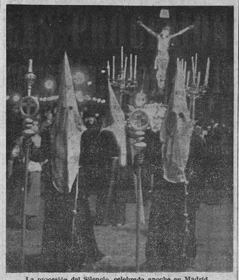
La procesión del Silencio, celebrada anoche en Madrid

El Caudillo, acompañado de su esposa e hija, asistió en El Pardo a los Santos Oficios del Jueves Santo