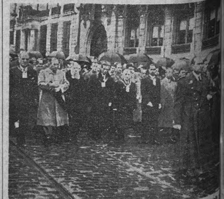
El Ministro de la Gobernación preside la procesión de Medinaceli