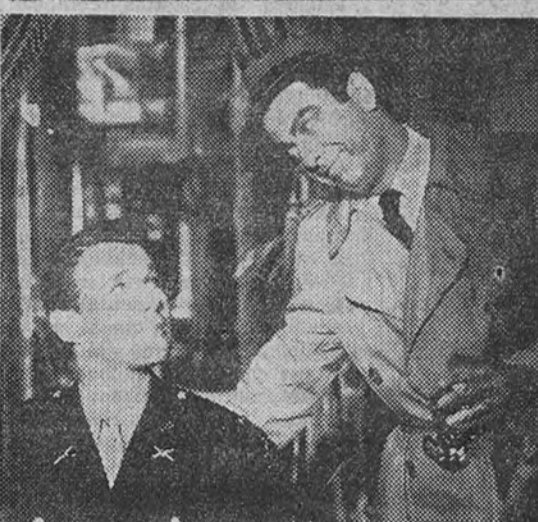
Charmant estreno hoy en el Avenida la última y más brillante creación de Diana Durbin: "Luz en el alma", basada en la novela de igual título original de W. Somerset Maugham. Con la joven estrella actúa el notable galán Gene Kelly