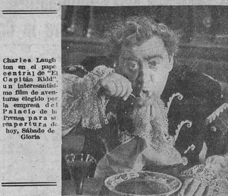
Charles Laughton en el papel central de "El Capitán Kidd", un interesante film de aventuras elegido por la empresa del Palacio de la Prensa para su repertorio de hoy, Sábado de Gloria