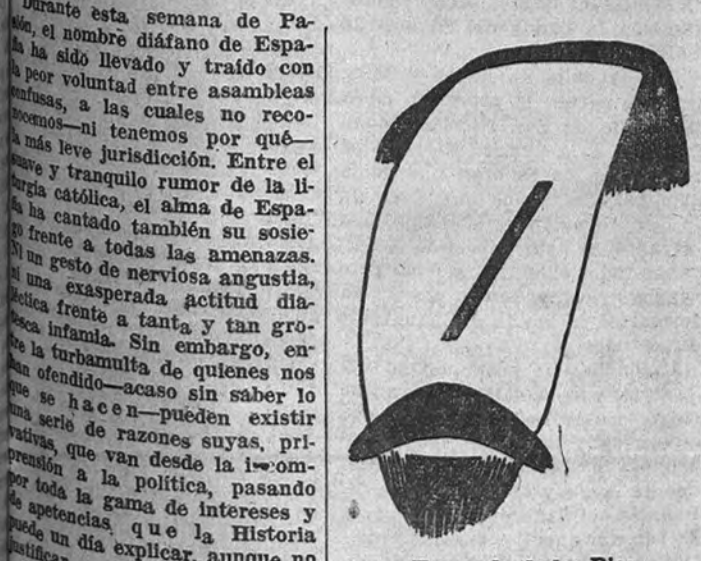
Fernando de los Ríos