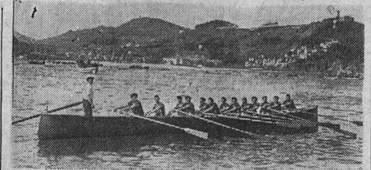
De ahora en adelante ya no habrá trucos técnicos en las regatas de traineras, pues las embarcaciones no podrán pesar menos de 200 kilos. Se acaba así la habilidad de los constructores, que ahora no podrán afinar tanto en el aligeramiento de las embarcaciones.

En todo tiempo y en toda edad las regatas de traineras tuvieron un germen de discordia: la embarcación. Desde que en el mar el motor de explosión sustituyó al remo, la discordia fue mayor. No habiendo podido la técnica de la «trainera» solucionar la cuestión de la «trainera» deportiva, y se creó la embarcación ultraligera, de líneas de agua depuradas, construida con materiales selectos, embarcaciones más rápidas, que fuera de rompeolas, y con las cuales tripulaciones jóvenes más estilizadas y bien entrenadas que potentes hacían maravillas. El año pasado, con el milagro del carpintero de ribera de alguna jurisdicción, el problema llegó a su punto neurálgico, y las pruebas tan emocionantes de las traineras, volviendo a otro de los períodos de eclipse que en estas pruebas son como las curvas de la historia. Este peligro ha quedado ya cortado. Se han reunido estos días, en Bilbao las representaciones federativas de Guipúzcoa, Santander y Vizcaya, presididas por don Juan B. Elice, presidente de la Federación Nacional de Remo,