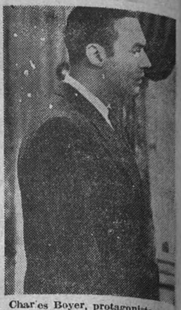
Charles Boyer, protagonista, con Bette Davis, de la superproducción "El cielo y tú", anunciada para hoy en el Palacio de la Música. Por el largo metraje del film se ruega la puntual asistencia del público

Hoy sale el extraordinario de extraordinarios cinematográficos. ¡100 páginas! ¡Algo distinto a todo! ¡Superior a cuanto se ha hecho! ¡Un canto al cine universal. El alarde cinematográfico de la temporada, editado por