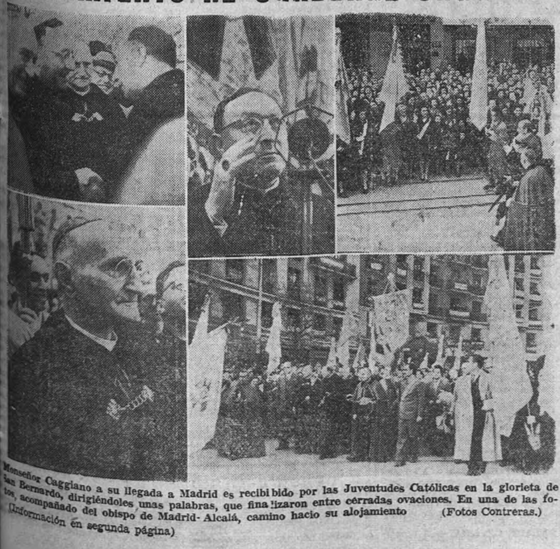
El cardenal Caggiano a su llegada a Madrid es recibido por las Juventudes Católicas en la glorieta de Bernabé, dirigiéndoles, unas palabras, que finalizan entre cerradas ovaciones. En una de las fotos, acompañado del obispo de Madrid-Alcalá, camina hacia su alojamiento.