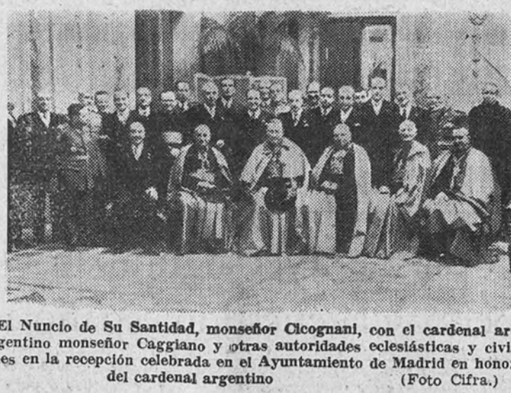
El Nuncio de Su Santidad, monseñor Ciccognani, con el cardenal argentino monseñor Caggiano y otras autoridades eclesásticas y civiles en la recepción celebrada en el Ayuntamiento de Madrid en honor del cardenal argentino

El ilustre purpurado celebró una misa de comunión en el Colegio del Sagrado Corazón