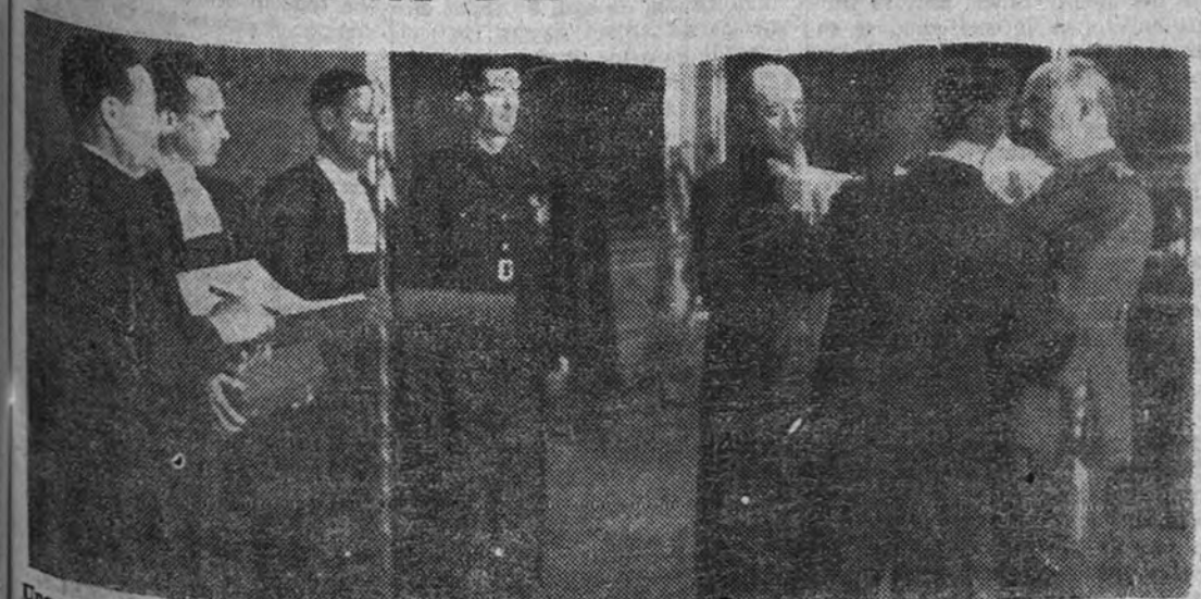
Una representación de la villa de Atienza ha entregado ayer al Caudillo el nombramiento de Hermano Mayor de la Cofradía de la «Caballada»