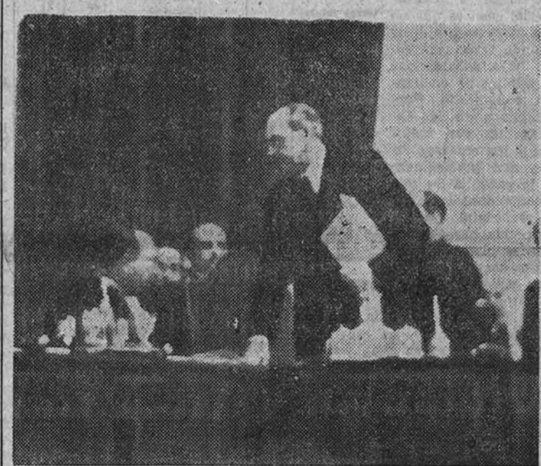
El Presidente de las Cortes toma juramento a los nuevos Procuradores recientemente nombrados