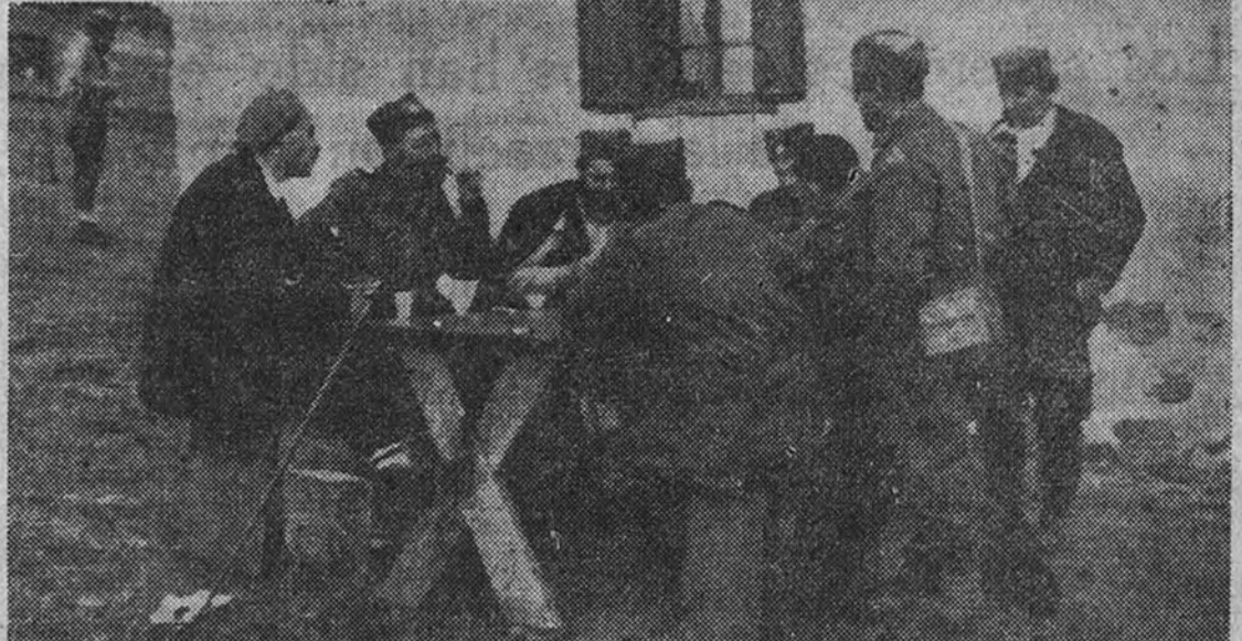
Mihailovich conversa con algunos oficiales de su Estado Mayor en una granja que de momento le servía de Cuartel General

OPOSICION CONTRA TITO Se puede afirmar tranquilamente que la oposición actual contra el régimen dictatorial de Tito alcanza un núcleo enorme de