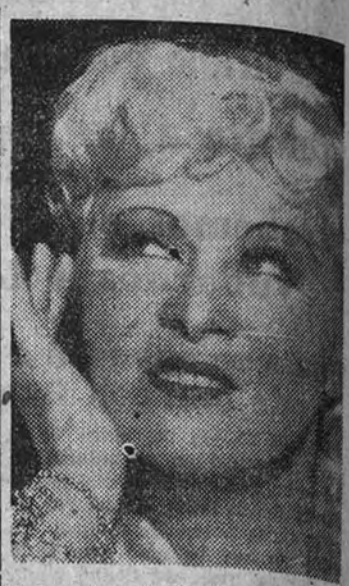
tora y empresaria. Otro gran triunfo vino a continuación, «Diamond Lil». Y después, una novela, de la que se hicieron varias ediciones.

Una de las películas que abrió un nuevo camino a las posibilidades técnicas por el profundo sentido simbólico de su trama, donde todo, hasta lo más pequeño, posee un gran valor, y donde el montaje ha jugado papel principalísimo.