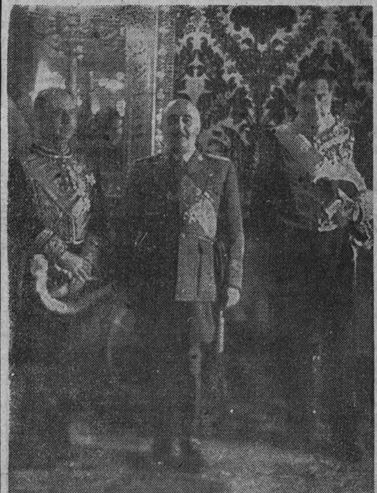
El nuevo embajador de Portugal, con el Caudillo y el Ministro de Asuntos Exteriores (Información en tercera página.)