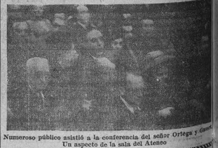
Numeroso público asistió a la conferencia del señor Ortega y Gasset. Un aspecto de la sala del Ateneo

La violencia de las explosiones hacia retremblar la tierra en muchas leguas a la redonda. Sobre Regensburg flotan grandes nubes pestilentes de diversos colores, que impiden acercarse a la ciudad.