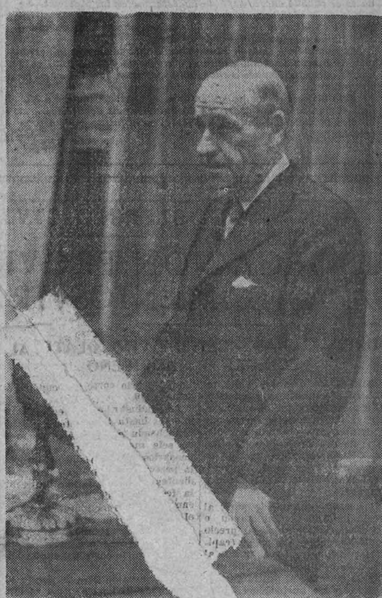
El filósofo don José Ortega y Gasset en la conferencia celebrada ayer en el Ateneo

Viejo que venís el Cid, viejo venís y florecido. Este emparejamiento entre lo héroe del Cid y yo, tan pacíficos—es decir, hacedor de paz—, sólo se justifica por la alusión a la vejez y a un posible florecimiento. El vigor de esta caricatura simboliza la continuidad que a todos debe animar. Continuidad es contubernio o cohabitación del pasado con el futuro. El único modo de no ser reaccionario es ir más allá.