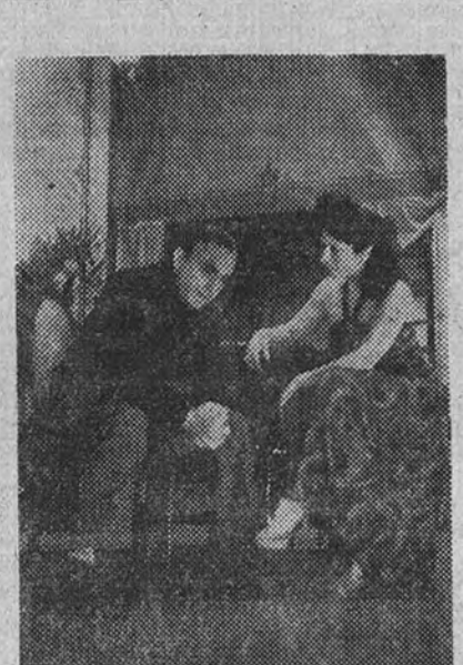
que habrás pasado por esos caminos... No, no vuelvas a enfadarte. No te pregunto de dónde vienes. ¡Que más da! Tienes el traje roto. Me gustaría consolarlo.

ELVIRA. —No. No estás cansado, nada más. Y tienes hambre, y sueño. ¿Lo