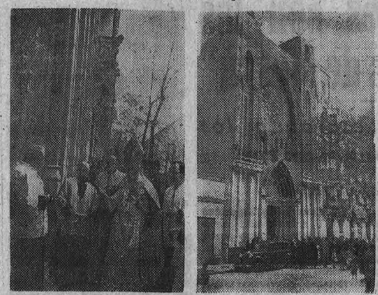
El obispo de Madrid-Alcalá, doctor Elío, bendiciendo el exterior del nuevo templo de San José de la Montaña, inaugurado ayer, y la fachada en construcción de esta iglesia madrileña, que se levanta con la aportación de limosnas.

El vicario de los Escolapios de España y América trasladó procesionalmente el Santísimo, asistiendo muchas personalidades