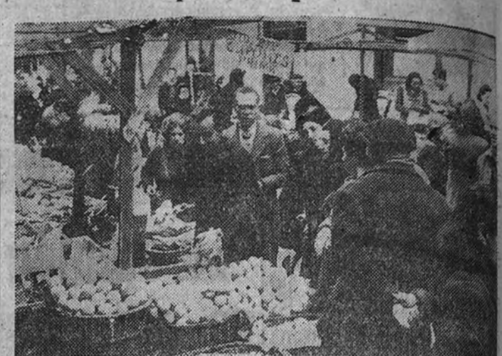
La foto recoge el aspecto de uno de los múltiples puestos de venta de frutas, con el letrero «Se admiten cupones», en los que se facilita la compra de dichos productos a los poseedores de las cartillas de tercera.