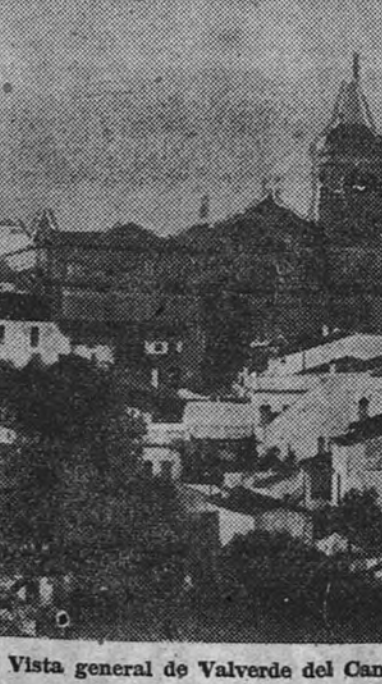
Vista general de Valverde del Camino