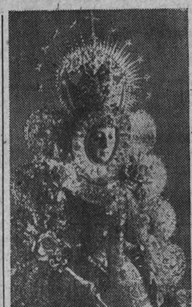
Nuestra Señora del Rocío, Patrona de Almonte

Día 6. A las nueve de la mañana saldrá procesionalmente, con dirección al Santuario de la Aldea del Rocío, la Real y Pontificia Hermandad de Almonte. Día 8. A las cinco de la tarde, solemne procesión de las Her-