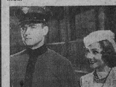
"El Duque de West-Point", estrenando ayer jueves en el Avenida, ha logrado uno de los mayores éxitos de la actual temporada