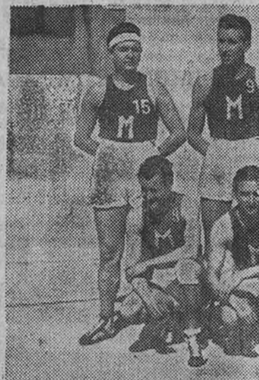
El equipo del Mongat, que en los próximos días 12 y 19 disputará con el Club de Regatas, de Palma, el paso a las semifinales del Campeonato de España

Los vencedores disputarán las semifinales al Barcelona y al Layetano