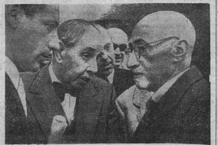
Nuestro Premio Nóbel, don Jacinto Benavente, conversa en el puerto de Barcelona a su llegada con el poeta Eduardo Marquina y otras personalidades.