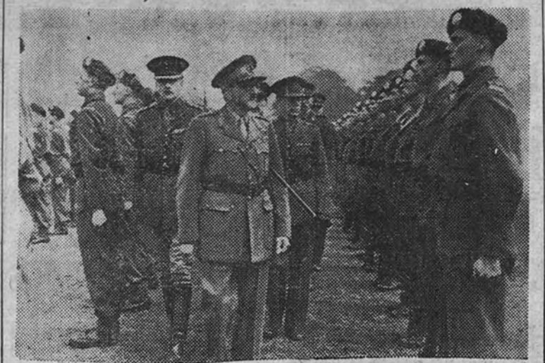
El mariscal lord Alan Brooke, antecesor de Montgomery en la jefatura del Estado Mayor Imperial, pasa revista, como último acto oficial, a los cadetes de la Academia Militar de Sandhurst.