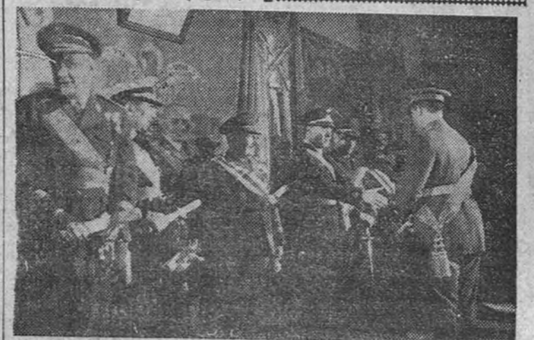
Los Ministros del Ejército, Marina, Aire y Obras Públicas durante la imposición de condecoraciones y entrega de diplomas a los nuevos ingenieros en la Escuela Politécnica

El profesor Hinkel terminó diciendo que España no representa ninguna amenaza para la paz mundial, pero que si con este pretexto se quiere investigar en España, urge mucho más que se investigue en Rusia y en sus países satélites: Polonia, Yugoslavia, Rumania, Hungría, Albania, Finlandia, Estonia y Lituania. (Efe.)