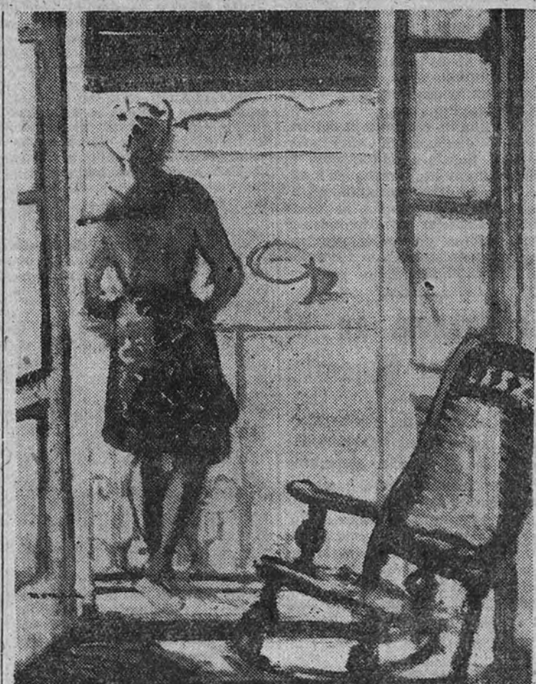
El balcón, por José Mompou

Esta preocupación de síntesis y velocidad la acompaña con la gran revelación del certamen.