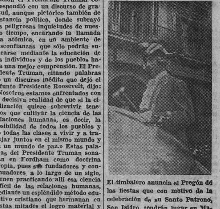
El timbalero anuncia el Pregón de las fiestas con motivo de la celebración de su Santo Patrono, San Isidro, tendrán lugar en Madrid. (Amplia información en segunda página.)