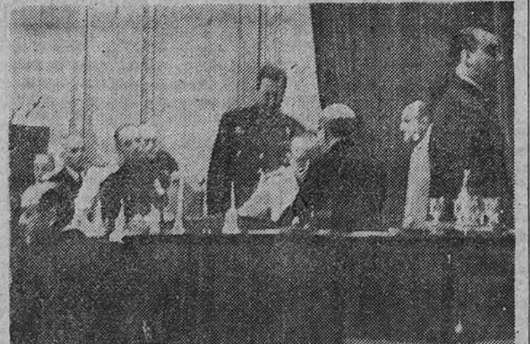
Instante en que los nuevos Procuradores juran ante el Evangelio sus cargos

de la Valdavia, da lectura al acta de la sesión anterior. Después, otro Secretario, lee la ley de 9 de marzo de 1945 que reorganiza y da vida a las actuales Cortes y a continuación se leída la lista de los señores Procuradores en Cortes. LOS NUEVOS PROCURADORES PRESTAN JURAMENTO Los nuevos Procuradores, «número de unos doscientos», prestan juramento. Uno a uno van desfilando ante el Presidente y, con la mano sobre los Evangelios, juran el cargo en la forma de ritual. Terminado este desfile, el Presidente dice: «Si así lo hacéis, que Dios os lo premie, y si no, que os lo demande.»