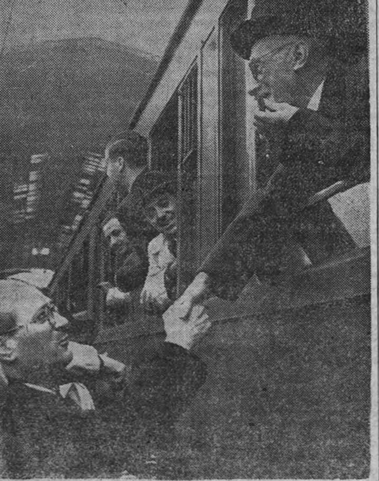
El pueblo de Madrid tributó el domingo un clamoroso recibimiento al insigne escritor, que con su presencia y su palabra ha defendido y proclamado la verdad de España. El Ministro de Educación Nacional, acompañado de altas representaciones, acudió a la estación del Mediodía y fue una de las primeras personas que estrecharon la mano del eminente dramaturgo, a quien hizo presente el saludo de bienvenido a la capital de España. (Información en quinta página.)