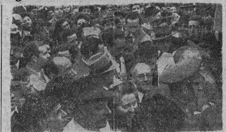
El numeroso público que le esperaba en la estación rodea a don Jacinto Benavente.