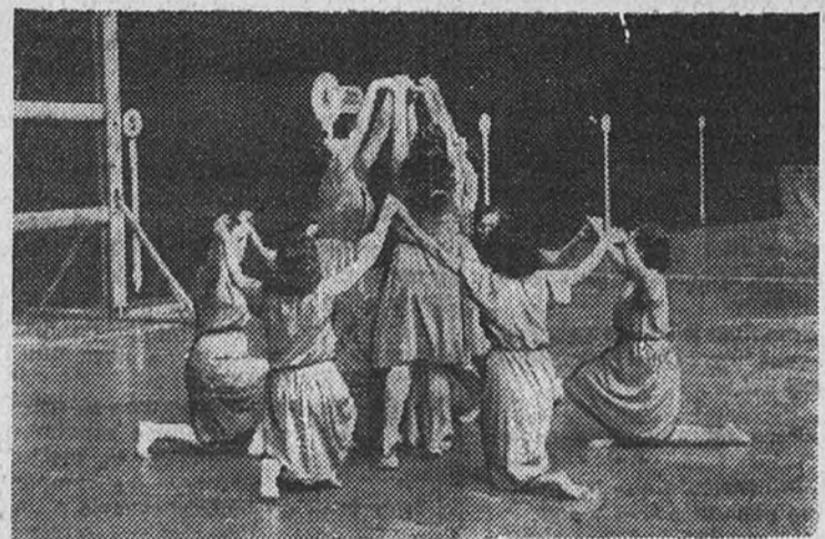
Conjunto de la Sección Femenina en uno de los ejercicios de gimnasia rítmica, cuyos Campeonatos nacionales comienzan hoy en el salón Victoria, de Madrid

Hoy comienzan en Madrid las pruebas del sector de Levante