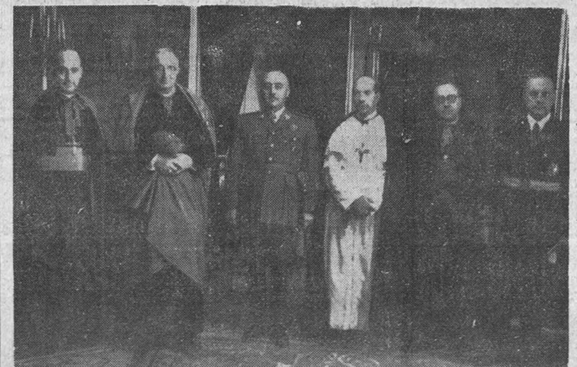
Su Excelencia el Jefe del Estado, acompañado del Ministro de Justicia y de los prelados de Valencia, Córdoba, Plasencia y Barbastro, a quienes ofreció un almuerzo en el Palacio de El Pardo