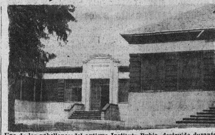
Uno de los pabellones del antiguo Instituto Rubio, destruido durante la guerra de Liberación

El Estado, con la constante preocupación por todos los problemas que tienden a una mejora del nivel sanitario, ha recogido en el último Consejo de Ministros la magna importancia que tuvo el Instituto Rubio en el desarrollo y