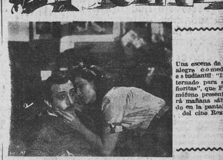
Una escena de la alegre comedia "Internado para señoritas", que Filmofono presenta mañana sábado en la pantalla del cine Rex