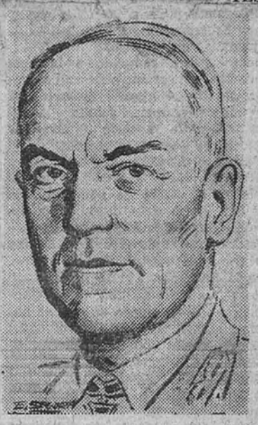
BUCAR 17.—El mariscal Antonescu ha sido condenado a muerte. El Tribunal popular dice que le ha encontrado culpable de crímenes de guerra y responsable del desastre del país. (Efe.)

SE LE DECLARA CULPABLE DE CRIMENES DE GUERRA Y RESPONSABLE DEL DESASTRE DEL PAIS