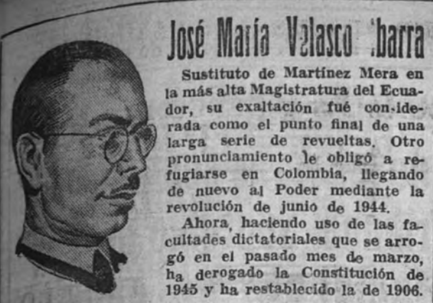
José María Velasco Barja

Sustituto de Martínez Mera en la más alta Magistratura del Ecuador, su exaltación fue considerada como el punto final de una larga serie de revueltas. Otro pronunciamiento le obligó a refugiarse en Colombia, llegando de nuevo al Poder mediante la revolución de junio de 1944. Ahora, haciendo uso de las facultades dictatoriales que se arrogó en el pasado mes de marzo, ha derogado la Constitución de 1945 y ha restablecido la de 1906.