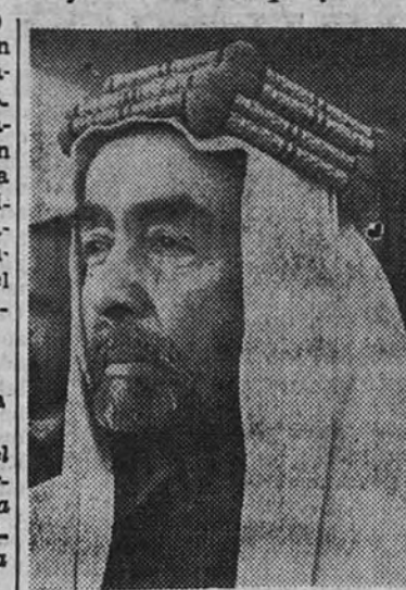
Abdullah Ibn Hussein

El éxito innegable de sus conversaciones con el Gobierno inglés le lleva, pues, a la realización de una antigua ambición, que tenazmente ha perseguido desde la primera guerra mundial. Desde el punto de vista de la legitimidad histórica de su familia, nadie con mejores títulos para ser Rey, ya que es hijo de un Rey, sus dos hermanos fueron Reyes y su sobriño riye los destinos del vecino Iraq, con la ayuda de un regente. El emir, que nunca pudo olvidar el esplendor de la vida de Cortés