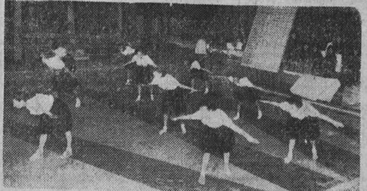
Prueba de gimnasia educativa de los Campeonatos nacionales de la Sección Femenina

Esta mañana han continuado las pruebas semifinales de los VI Campeonatos nacionales de gimnasia educativa de la Sección Femenina de F. E. T. y de las J. O. N. S. que se están celebrando en estos días en Madrid. En las pruebas de esta mañana tomaron parte los siguientes equipos: