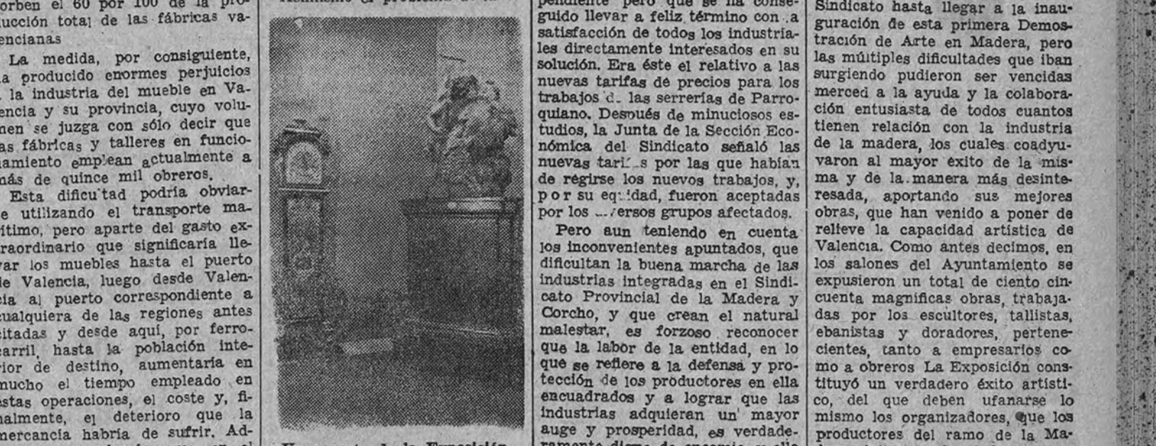
Un aspecto de la Exposición