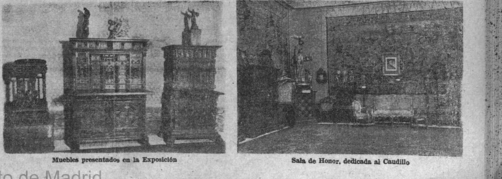
Muebles presentados en la Exposición