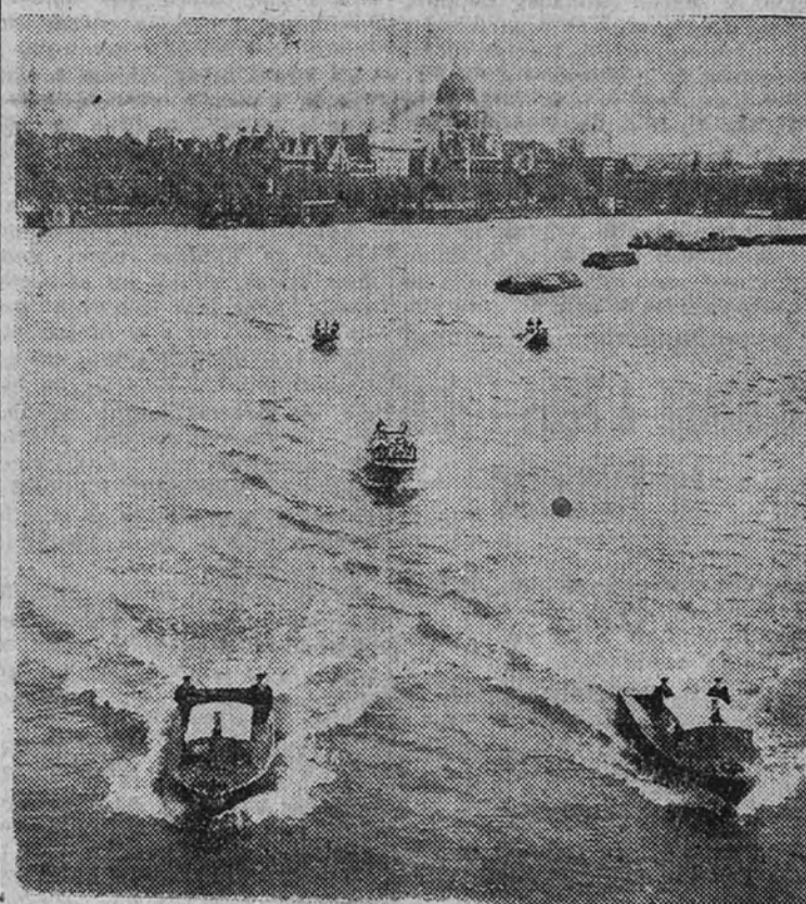
Escalada por lanchas de la Policía la baranca real realiza un viaje de ensayo por el Támesis, en preparación para la cabalgata acuática de la Victoria que se celebrará la noche del 8 de junio