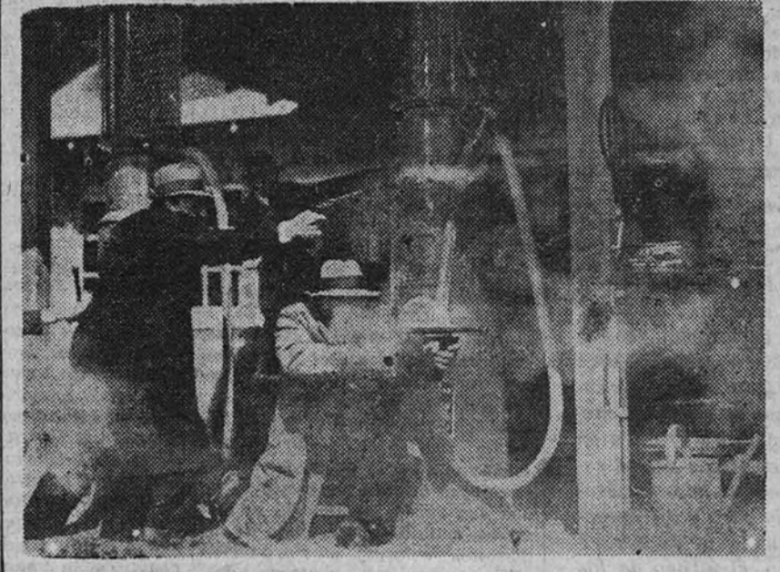
Una escena de «El héroe público»