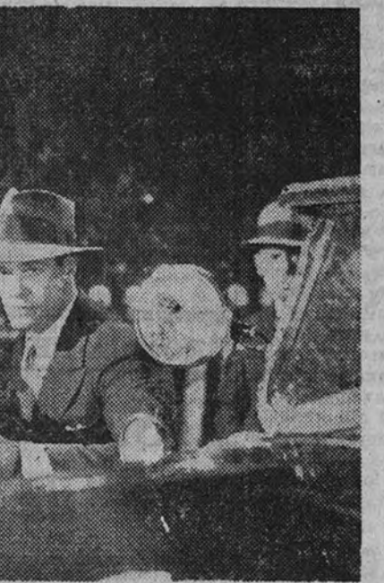
Chester Morris, en la película «El héroe público»

HACE varias semanas se ha celebrado en la ciudad de México, organizado por la Sociedad Mexicana de Geografía y Estadística, el Segundo Congreso Nacional de Ciencias Sociales. En el citado Congreso ha ocupado una parte muy importante el problema cinematográfico y las películas que actualmente se hacen y proyectan.