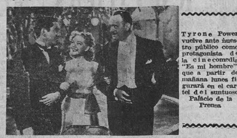
Tyrone Power vuelve ante nuestro público como protagonista de la cine-comedia "Es mi hombre", que a partir de mañana lunes figurará en el cartel del suntuoso Palacio de la Prensa.