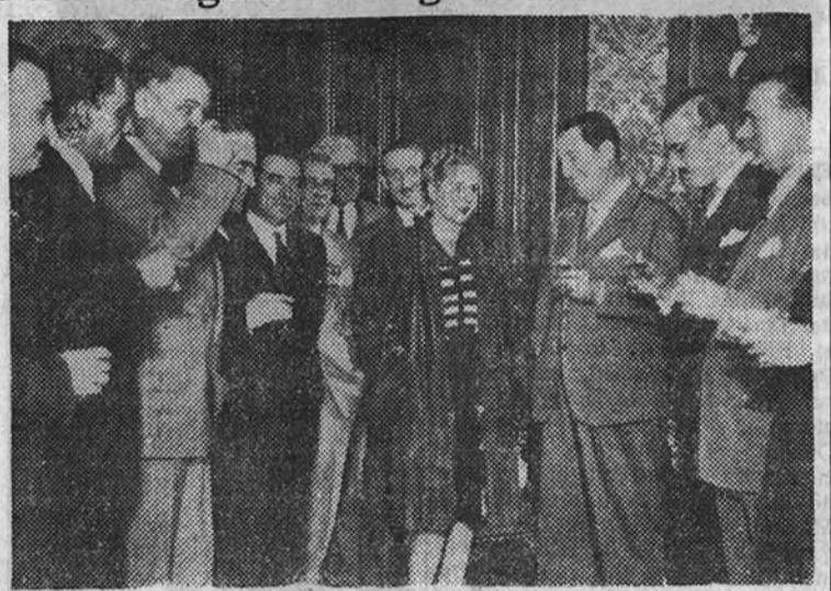
Perón y su esposa son objeto de un agasajo durante una visita a la Cámara de los Diputados

«No queremos destruir los capitales. No queremos arruinar la industria, como algunos han asegurado. Queremos, sí, aumentar la riqueza del país, dar agua y luz, primar el latifundio, haciendo que el criollo que nació en esta tierra pueda vivir en ella dignamente, sin desgracias, sin miserias, que apocan al hombre y le quitan su verdadera libertad... Pero que sepan los malos y los egoístas que sepan esos que frente a nuestros «vivos» jubilosos dan tantos «muertes» mercenarios y de odio, que sepan los bandidos, que sepan los cobardes y los fraudulentos que si algún día al pueblo argentino se le cercenan sus derechos individuales o colectivos han de terminar los hombres de paz para comenzar los hombres de lucha. Y en esa lucha no hemos de dar un paso atrás». Estas palabras las que en ella ha de verse y saberse si Estados (Continúa en tercera página.)