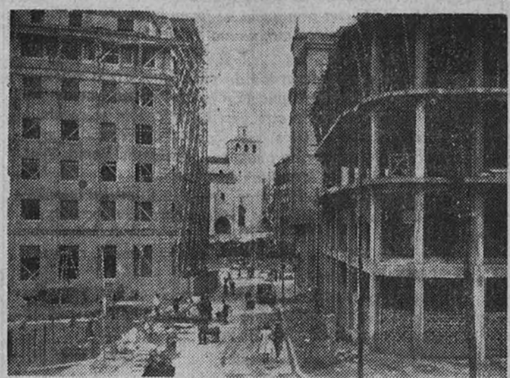
Un aspecto de la reconstrucción de Santander. Al fondo, la catedral

OBRAS DE AMPLIACION Pero había muchos años que la catedral se le había quedado chica a Santander, y la ocasión del incendio se aprovechó para alargar la iglesia. De aquí que si en esta crónica se podría de hecho anunciar el fin de la restauración cate-