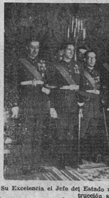
Su Excelencia el Jefe del Estado recibe a la primera promoción de ingenieros de Armamento y Construcción salida de la Escuela Politécnica del Ejército