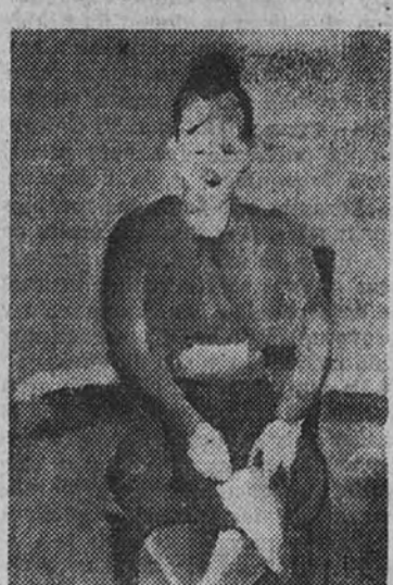
Figura, por M. Ciruelos

En el actual momento aparece dedicado a temas leves, inconsistentes, entregado a un juego de paleta pleno de grises sutiles y de tonos transparentes, similares en valor y calidad a la acuarela. Tal es su ingenuidad cromática, que para mostrarla mejor oculta la energía constructiva de que le sabemos poseedor. Quizá convendría al artista recordar en sucesivas Exposiciones la firmeza de su temperamento, que nosotros consideramos es el primordial valor de su arte, capaz, no obstante, de la más amplia gradación técnica, no apreciada con solamente estas obras. Por los cuadros de figura que vemos en esta Galería y la textura vaporosa con que los pinta no pue-