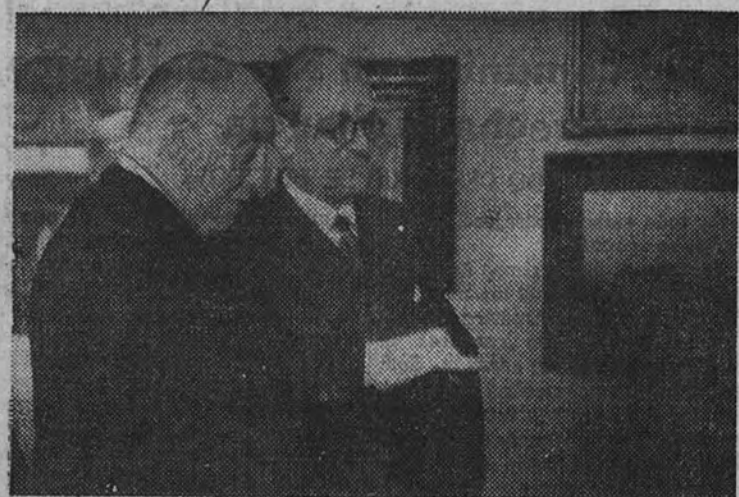
Ayer, en los salones de la Sociedad de Amigos del Arte, fué inaugurada oficialmente, para ser abierta hoy al público, una Exposición Nacional de la Acuarela. Fué visitada por el Ministro de Educación Nacional, señor Ibáñez Martín, quien recorrió detenidamente esta instalación artística. En esta foto aparece el Ministro acompañado durante el recorrido a la Exposición por el académico de Bellas Artes marqués de Mored.

Inaugurada ayer oficialmente, quedará hoy abierta al público