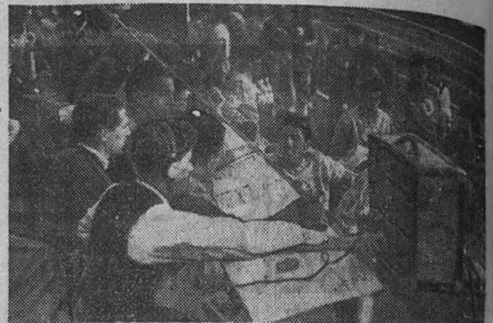
El Equipo Móvil de Radio S. E. U. retransmitiendo unas pruebas de portivas.

Tres fines esenciales cumple la vida propia de Radio S. E. U.: educar, formar e informar. Como labor de tipo educacional pueden considerarse las emisiones «Radio Escuela», «Boletín de la Escuela de Comercio» y las que se hacen para bachilleres, con un tono cálido sobre la vida estudiantil, despertando el interés del estudiante. Una buena ayuda para desarrollarla encuentra en los directores de los centros docentes, y esto servirá para montar en octubre próximo nuevas emisiones dedicadas a graduados y licenciados de Farmacia, Medicina, Derecho, Filosofía y Letras, Ciencias y Veterinaria, que se realizarán con la colaboración de los Colegios Nacionales respectivos, claustros de las Facultades