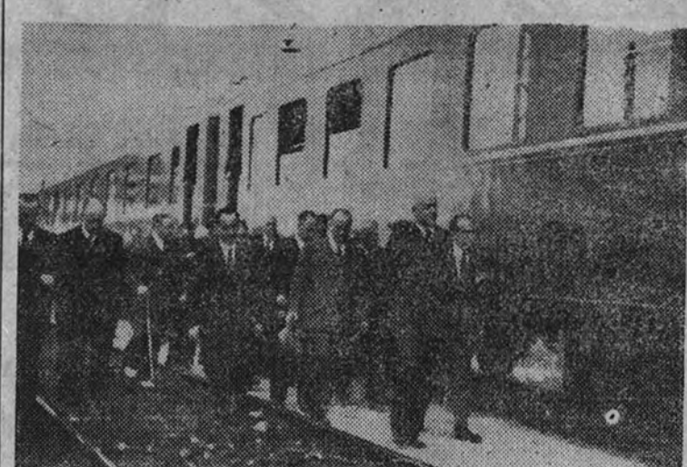
El Ministro de Obras Públicas y sus acompañantes ante los nuevos coches metálicos

Se efectuó ayer con asistencia del Ministro de Obras Públicas y otras personalidades