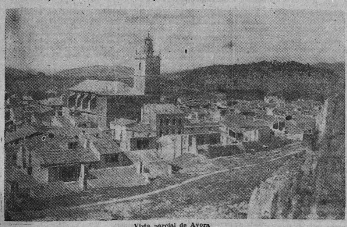
Vista parcial de Ayora

Entretanto, siete mil soldados de Infantería, Artillería y algunas unidades de alpinos llegaron al palacio real y lo rodearon para impedir que se acercara nadie. Las tropas iban equipadas con ametralladoras ligeras y estaban dotadas con grandes cantidades de municiones. Se supone que el Gobierno, en su mayoría republicana, en su empeño de resolver el problema de la Monarquía con carácter urgente.