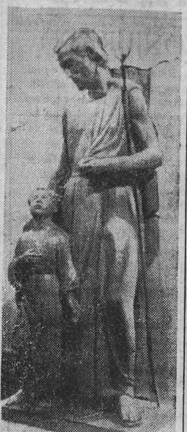
Imagen de San José, obra de José Clará

Homenaje a Walt Disney La última de las comidas que mensualmente celebran los críticos de Arte de los diarios y semanarios madrileños ha sido celebrada en honor del gran dibujante