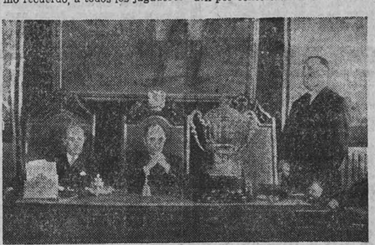
El Alcalde preside el acto de homenaje ofrecido a los jugadores del Real Madrid por el Ayuntamiento de nuestra capital

Reina gran animación para esta fiesta, pues los madrileños quieren testimoniar a los nuevos campeones su cariño y admiración. En épocas sucesivas esta industria atravesó por diversas vicisitudes, y en la actualidad, merced a la protección que dispensa el Estado al trabajo en todos sus aspectos, ha vuelto a recuperar su antiguo esplendor, aunque ello haya sido a costa de no pocos esfuerzos y sacrificios, ya que los últimos tiempos, con la escasez de materias primas, restricciones eléctricas y otras dificultades, no han sido muy favorables.