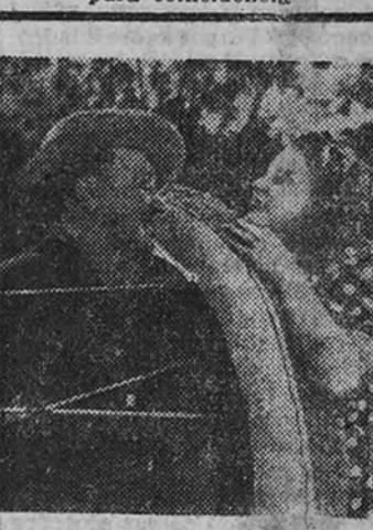
"Loculandia", el más gracioso y disparatado film realizado hasta el día, será presentado próximamente por Chamartín en un local de la Gran Vía