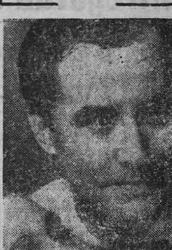
John Hubbard, gau de la comedia "Vidas ambulantes", próximo estreno de Ceplosa. Esta película, que interpretan también Carole Landis y Adolphe Menjou, ha sido dirigida por Hal Roach