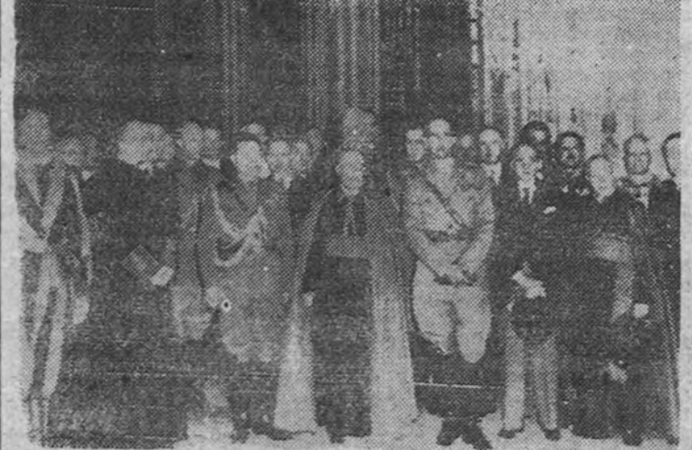
El Rey Humberto de Italia antes de abandonar su país ha sido recibido en audiencia especial por Su Santidad el Papa, en visita de despedida. En nuestra fotografía, el Rey Humberto, acompañado de algunos cardenales y altos dignatarios del Vaticano, al salir de la entrevista con Su Santidad.