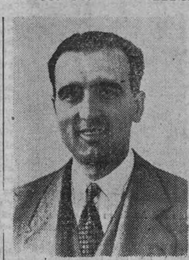
Don Joaquín Ruiz Jiménez