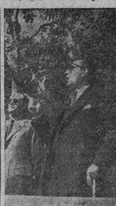
El Alcalde, pronunciando su discurso