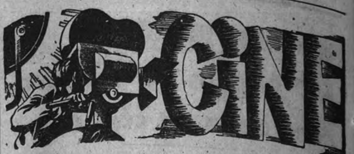
EMIL JANNINGS, EN EL REX