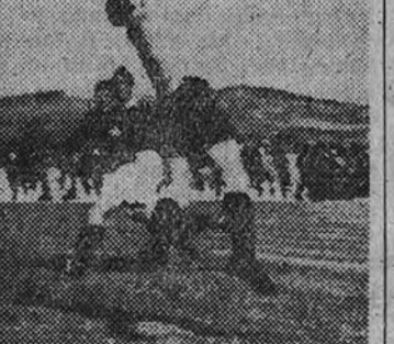
El portero portugués, Acevedo, desvia a córner un peligroso balón lanzado por la delantera irlandesa

Poco antes de finalizar el primer tiempo se anula un tanto a Portugal, por estimar el árbitro que había sido conseguido en fuera de juego.