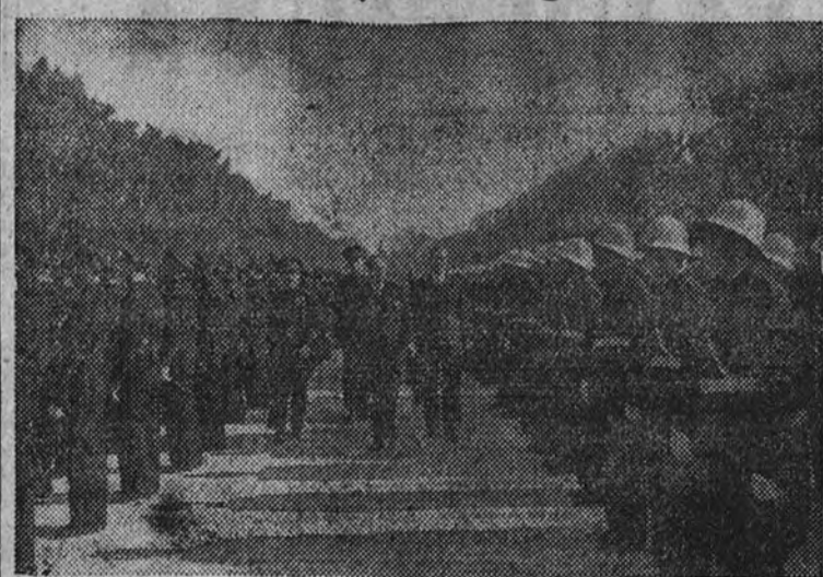
El Alcalde pasa revista a las fuerzas de la Policía Municipal