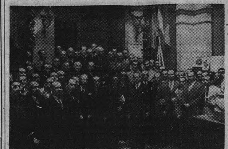
Los congresistas de Urología española y portuguesa, con las personalidades que presidieron el acto inaugural, en la Academia de Medicina

En nombre del Ministro de la Gobernación, presidió la sesión de apertura el doctor Cortezo