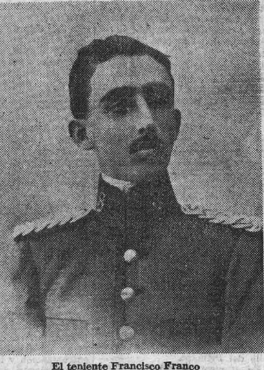
El teniente Francisco Franco

Son las seis de la tarde. Un sol de fuego se filtra por las hendijas de una persiana, tiñéndose en ellas de un color que lo refresca. Estamos solos, en un salón amplio, ordenado y limpio hasta la exageración—despacho de médico y de médico higienista—el hombre que habla y el periodista que anota, que es todo oídos porque no quiere perder detalle de un relato que sólo este señor puede hacer en España. Ca-