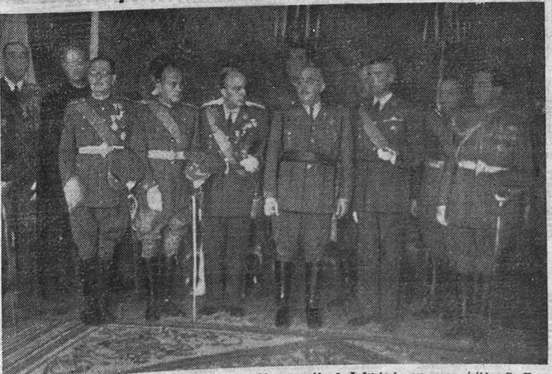
El Caudillo, acompañado de los miembros de la 26.ª promoción de Infantería, que ayer visitó a Su Excelencia, expresándole su entusiasta adhesión y homenaje.