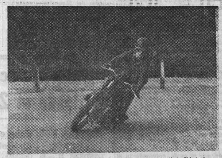
Premio de Madrid, y el circuito, antes silencioso, dejó paso a la velocidad y al ruido de nuestros tiempos. El olor de la gasolina y del ricino mandan.

Los platoonos de las motocicletas parecen ahuyentar a los pájaros que se cobijaban en sus frías umbrías. Han comenzado los entrenamientos del Gran