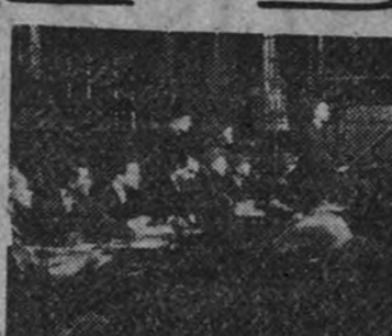
Fox anuncia el próximo estreno en el Palacio de la Música de "La casa de la calle 92", a una de cuyas escenas corresponde esta foto

BOXEO CINE ACTUALIDADES 2.ª SEMANA DE ÉXITO VERDADERO DEL SENSACIONAL COMBATE DE BOXEO, ENTRE