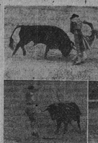
Llorente y Escudero en lances de capa, y dos momentos de Morenito de Talavera, con las banderillas y la muleta

Y conste que hablo—por imaginación—de hace mucho tiempo. De como el otro Rafael debía de matar en sus principios, o sea, un par de años antes de 1900. Hará unos cincuenta. ¡Crédito! Ni a Machaquito yo le vi del 10 al 13. El que lo viera