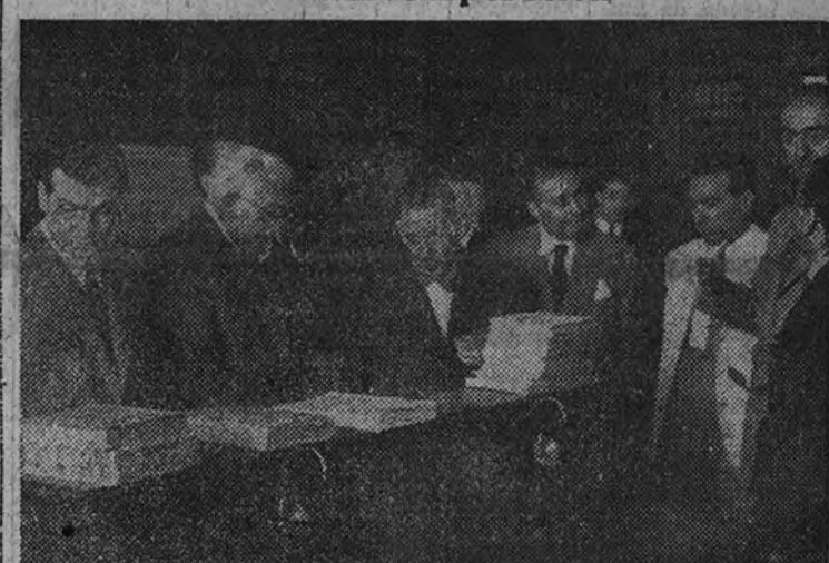
Los periodistas chilenos que recorren España, en su visita al Colegio de Abogados.

Fué recibido por la Junta de gobierno de la Corporación