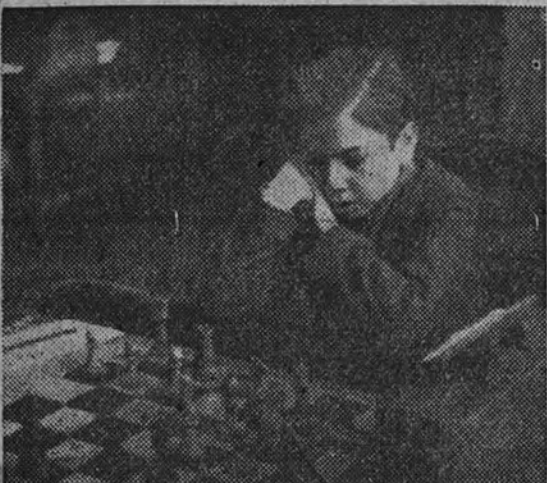
Arturo Pomar afirma su gran forma—su clase estaba demostrada—al vencer en el Campeonato nacional de ajedrez

El triunfo de Arturo Pomar en el Campeonato de España de ajedrez 1946, es un hecho que coloca por primera vez a un niño de quince años en la supremacía de este deporte. El triunfo de Arturo Pomar en el Campeonato de España de ajedrez 1946, es un hecho que coloca por primera vez a un niño de quince años en la supremacía de este deporte.