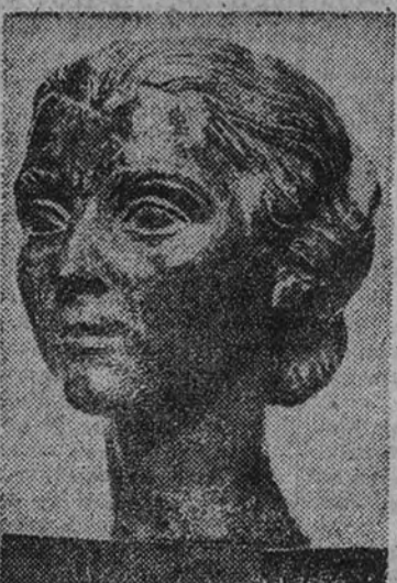
«Cabeza de Joven», bronce