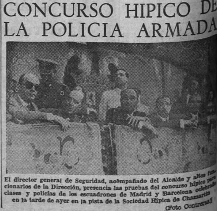
El director general de Seguridad, acompañado del Alcaide y otros funcionarios de la Dirección, presencia las pruebas del concurso hipico para clases y policías de los escuadrones de Madrid y Barcelona celebrado en la tarde de ayer en la pista de la Sociedad Hipica de Chamartín

Le habrá devuelto con iniciales el tenedor de plata que le robó el año pasado con igual motivo?