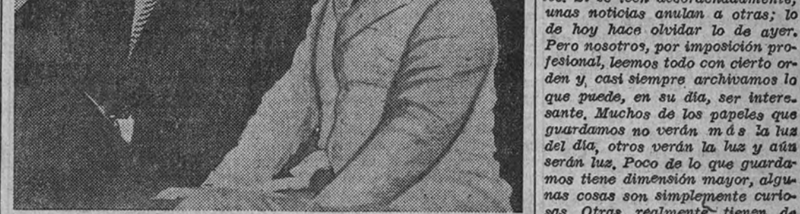
El Presidente de la República Argentina, general Perón, conversando con el autor de este artículo

Estas tres noticias sueltas no tienen verdaderamente demasiada importancia. Ni siquiera las tres juntas son capaces de hacer surgir una modesta «cola» ante un quiosco de periódicos. Pasan desapercibidos. No han merecido ninguna de ellas la preocupación del menor comentario. Y si hoy las traemos nosotros a estas columnas es tan sólo para poner de manifiesto el hecho de que cualquier pequeña información suelta puede valorizarse al sumarla con otras de su misma especie. La suma, después, se comenta sola.