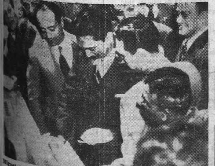
Miguel Alemán, Presidente de Méjico, emite su voto durante las elecciones presidenciales celebradas el pasado domingo, en las que resultó triunfador.