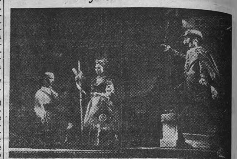
Una representación de marionetas

Será levantado en el Retiro por el Ayuntamiento