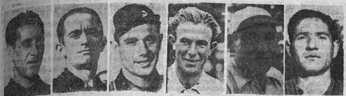
Los seis hombres que componen el equipo español que participará en la Vuelta a Suiza y que luchará contra las potentes representaciones de Bélgica, Suiza, Holanda, Luxemburgo, Italia y Francia.

El equipo español contendrá con los países más calificados en ciclismo. Cerca de dos mil kilómetros, en ocho etapas, marcan la dureza de esta prueba