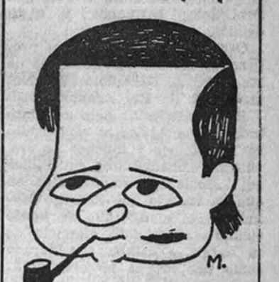
Miguel Mihura estuvo una noche viendo una función que rechazaba en no sé qué teatro y que se llamaba «Marin». A la mañana siguiente un impulso irresistible y misterioso le condujo hasta el estancador del Retiro. Miguel Mihura desde entonces sintió una fatal inclinación marinera, que le ha llevado a la cubierta de un barco de cabotaje y a desangrarse de mostrar en mostrador por todos los bares portuarios.

Ahora Miguel Mihura, nuestro enternecedor amigo y particular humorista, nos cuenta sus aventuras entre los piratas, los barcos—que parece ser que habitan en el mar—, las sirenas y las merluzas. Ha dado la vuelta a España, como quien no quiere la cosa, y ha encontrado su peripetia tan bonita, por lo menos, como la Feria de Sevilla. Y como ya hablo de la Feria a nuestros lectores, el hombre no quiere privarse del gusto de presumir de Sandoz y en una serie de crónicas contará sus experiencias navegantes. Desde luego nos confirmará por telegrama que no ha llegado a descubrir América. Esferas de nuestros lectores que aprecien su literatura, su esfuerzo y sus penosos mares. Próximamente publicaremos su primer trabajo.