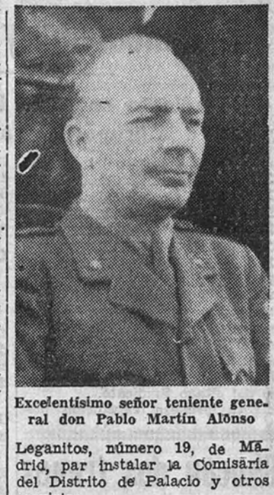
Excelentísimo señor teniente general don Pablo Martín Alonso

En la Subsecretaría de Educación Popular se facilitó anoche la siguiente referencia de lo tratado en el Consejo de Ministros celebrado bajo la presidencia de Su Excelencia el Jefe del Estado: PRESIDENCIA. —Decreto por el que se establece el régimen de dependencia de las posesiones españolas del Áfricaidental. Decreto por el que se disuelve la Comisión de Reivindicación de Bienes en el Extranjero. Decreto por el que se encomienda al Instituto Nacional de Industria la creación de una empresa mixta, con la misión fundamental de ejecutar el plan de aprovechamiento hidroeléctrico integral del río Noguera Ribagorzana y sus afluentes. ASUNTOS EXTERIORES. —Acuerdo sobre extensión de los recargos a que se refiere el artículo primero del decreto de 15 de abril último en favor de los miembros del Cuerpo Diplomático Extranjero acreditado en España. GOBERNACION. —Decreto por el que se regula la norma para aumento de precios unitarios de obras ejecutadas por el Ministerio de la Gobernación con posterioridad al 1 de abril de 1946, mediante el procedimiento de subasta o concurso. Decreto por el que se concede sepultura perpetua a los Caídos por Dios y por España víctimas del terror marxista. Expedientes de construcción de un edificio destinado a cuartel de la Policía Armada y de Tráfico en San Andrés (Barcelona) y reparación y ampliación del cuartel de Policía Armada y de Tráfico denominado de "Zaragoza", de Madrid, y de obras del edificio propiedad del Estado, situado en la calle de