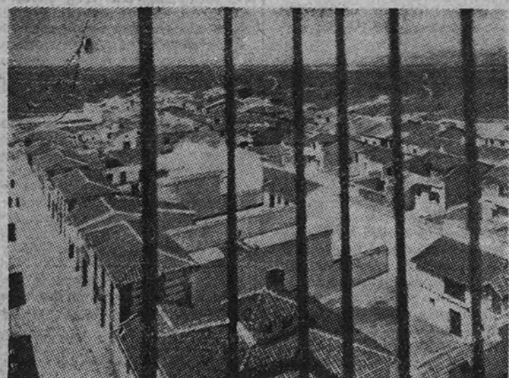
El pueblo de Brunete, reconstruido

El primer lote de viviendas se inauguraba exactamente un año después de iniciarse las obras, haciéndose la entrega de las mismas a sus futuros moradores—antiguos vecinos del pueblo destruido—por Su Excelencia el Jefe del Estado, quien en esta misma fecha inauguró también la primera calle del nuevo Brunete, la calle de la Paz.