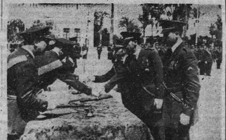
El solemne acto de entrega de despachos en Los Alcázares a los nuevos oficiales de la Academia de tropas de Aviación