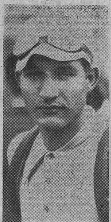
El italiano Bartali, clasificado hasta la cuarta etapa en primer lugar de la Vuelta a Suiza

Es una prueba muy semejante a la confirmación de las alternativas, que encierra algo de lo mucho que dice el refrán: "Lo difícil no es llegar, es mantenerse". D. A.