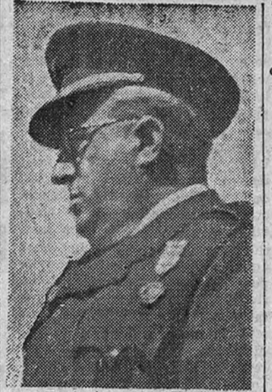
Teniente general Yagüe

Obras Públicas a don Rafael Benjumea Burín. Decreto por el que se autoriza la ejecución por administración de las obras de ampliación y mejora de la línea férrea de Tudela a Tarazona. Expedientes de obras de mejoras y modernización de carreteras; de conservación, acondicionamiento y reparación. (Continúa en cuarta página.)