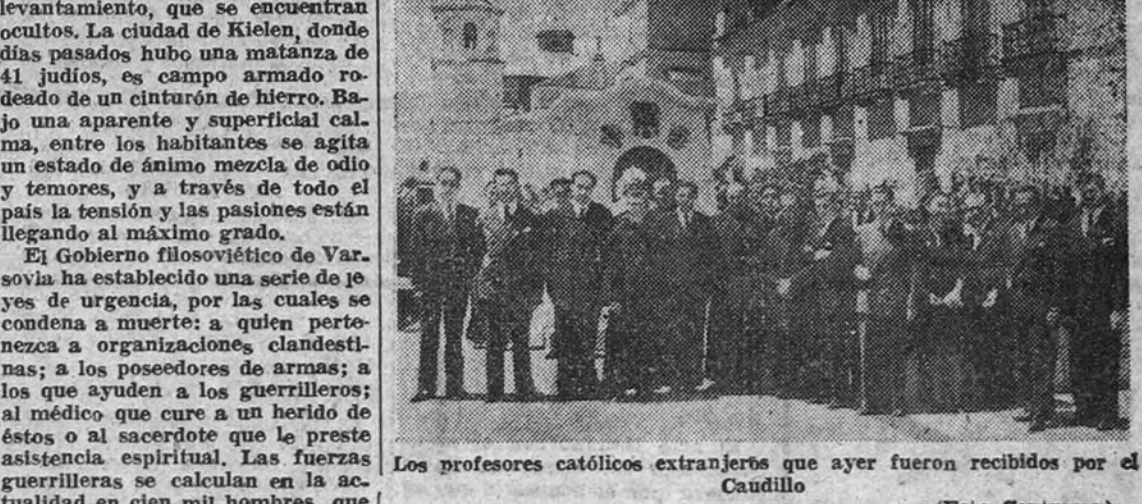
Los profesores católicos extranjeros que ayer fueron recibidos por el Caudillo

También recibió a los estudiantes católicos llegados con igual motivo