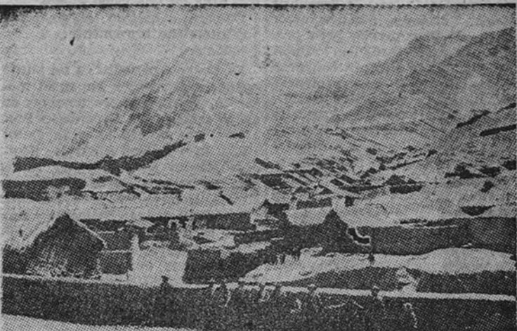
Casero minero en los alrededores de Colquechaco

El teniente coronel Gualberto Villarroel, el Presidente de la República boliviana que ha sido tan bárbaramente sacrificado por la revolución, el pasado domingo, en el palacio del Gobierno de La Paz, no es, ni mucho menos, el primer jefe de aquel Estado que ha tenido tan desastrosos fin; probablemente pasan de la media docena los Presidentes asesinados desde la proclamación de la independencia, en 1825. Los golpes de Estado constituyen en Bolivia una auténtica epidemia. A partir del 6 de agosto de 1917, en que subió al Poder el doctor José Gutiérrez Guerra, se han sucedido nada menos que trece situaciones presidenciales, ninguna de las cuales consumió por completo los cuatro años del mandato constitucional: seis Presidentes, incluido Villarroel, fueron destituidos por sendos alzamientos; dos sólo tuvieron un carácter provisional; otros dos duraron poco más de un año; y uno—el general Germán Busch—se suicidó, el 23 de agosto de 1939, por causas todavía no suficientemente esclarecidas. Pero la inestabilidad institucional no es menos endémica: antes de la promulgación de la ley del 28 de octubre de 1880 Bolivia conoció la vigencia de nueve Constituciones sucesivas; luego, la de 1880 sufrió seis reformas; finalmente, el 30 de octubre de 1938 el general Busch promulgó la actual, no sabemos por cuánto tiempo.