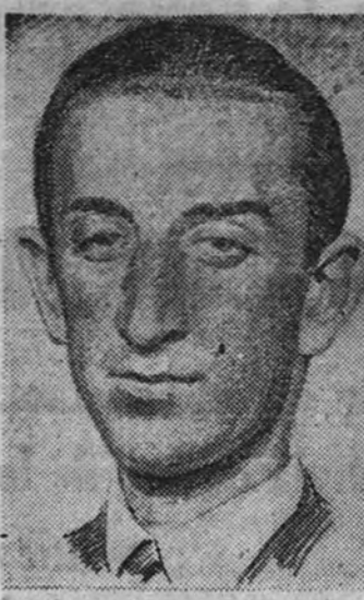
Manuel Rodríguez, «Manolete»

Las corridas de la Diputación—dice el señor Almagro, en busca de una iniciativa—suelen ser de