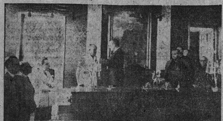
El Gobernador Civil, don Carlos Ruiz, impone la Medalla del Mérito Civil al Alcalde de Vallecas, don Alfonso Vázquez

El Gobernador Civil impuso al Alcalde, camarada Alfonso Vázquez, la Medalla del Mérito Civil