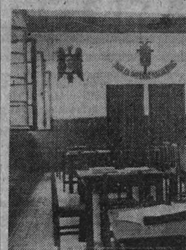
Salón de juegos del Hogar Rural de Manzanares

Una pausa, un cigarrillo, y el motivo fundamental de mi visita,