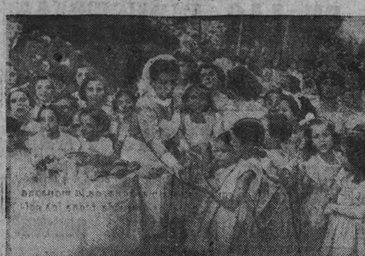
Las enfermeras del P. N. A. distribuyen entre las niñas la merienda con que les obsequió el Ministro de la Gobernación (Foto Contreras).

Cinco mil serán los pequeños que este año irán a las playas y montañas