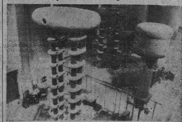
Este grupo de generadores instalados en los laboratorios de la Universidad de Cambridge, donde son estudiados, los problemas de la desintegración atómica, son capaces de producir un total de dos millones de voltios de fuerza motriz