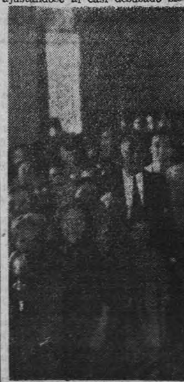
Personas menesterosas a quienes actualmente se socorre con dos pesetas diarias en el Ayuntamiento