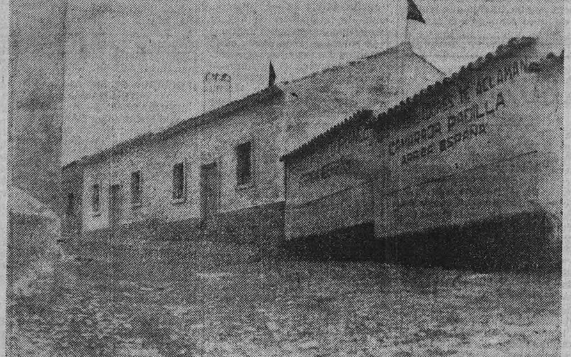
Dos de las viviendas que el Ayuntamiento regala mediante sorteo a las familias necesitadas

También será un hecho próximo, mediante la construcción de un parque municipal y un parque de deportes, cuanto queda dicho es el más vivo y claro exponente del desarrollo industrial y productivo que en Ubeda se está realizando, en donde, para orgullo de sus habitantes, no queda obligación alguna cumplida por parte de las autoridades, ni necesidad de desmentirlas, gracias al acierto de nuestro Caudillo, que, como en todas cosas, ha sabido encontrar hombres que velen por España.