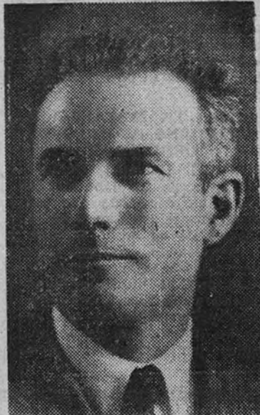
Andrés Padilla y Padilla, Alcalde de Martos

consiste en olivares en su casi totalidad, está sumamente repartida. Es muy raro que una familia no tenga su "pie de olivas", que por escaso que sea el número de éstas, como son tan pródigas, ellas, por sí solas, constituyen base suficiente para hacer cara a las necesidades de orden económico. Esta circunstancia de que todos sean propietarios de olivares no quiere decir que no existan acudados terratenientes que recolectan varios millares de arrobas de aceite, hablando quien dispone de varias fábricas enclavadas en el seno de sus ingentes y diseminados predios sólo para la mouturación de su cosecha.