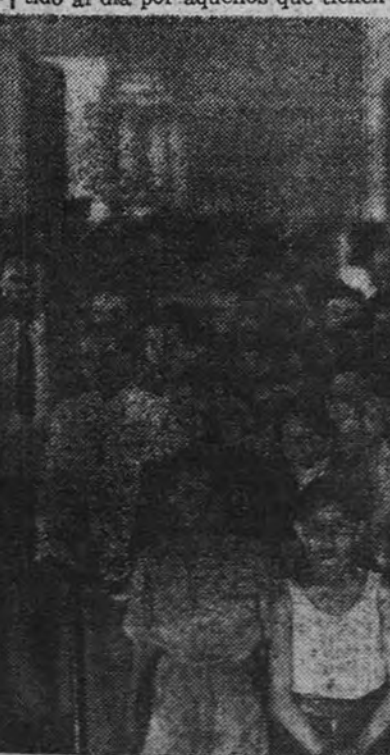
Personas menesterosas a quienes actualmente se socorre con dos pesetas diarias en el Ayuntamiento