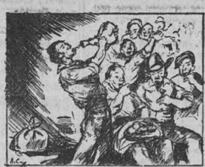
La merienda en los tendidos...