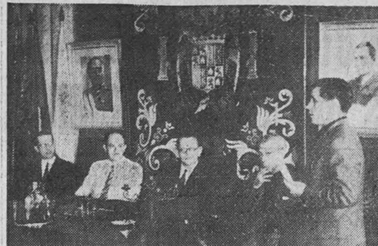
La presidencia del Pleno del Consejo Económico Sindical de la provincia de Madrid celebrado ayer en la C. N. S.

La sesión estuvo dedicada al estudio del abaratamiento de la vida