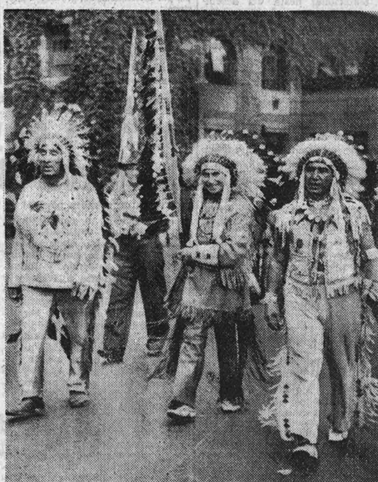
Estos jefes indios van presidiendo una manifestación de 1.500 compañeros de raza por las calles de Nueva York, en conmemoración de los prisioneros de guerra de los indios.