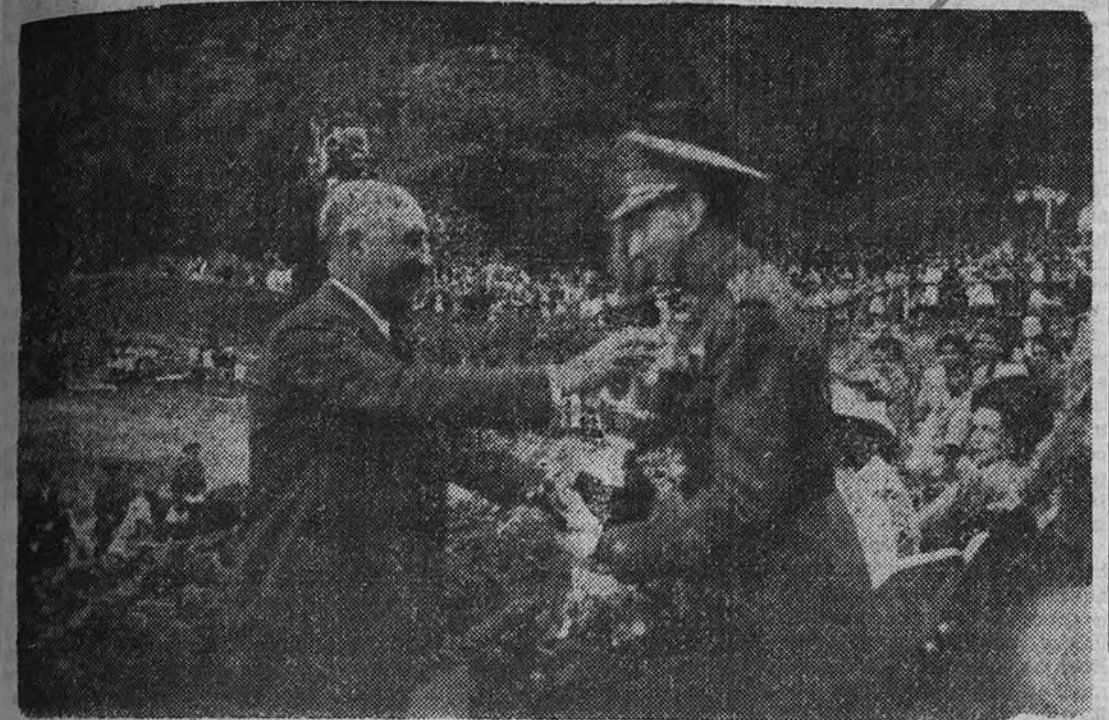
El Caudillo entrega al teniente coronel Navarro, vencedor en la prueba del concurso hípico, la Copa del Generalísimo

Acompañado de su esposa, el Generalísimo asistió anoche a una cena de gala en la Diputación