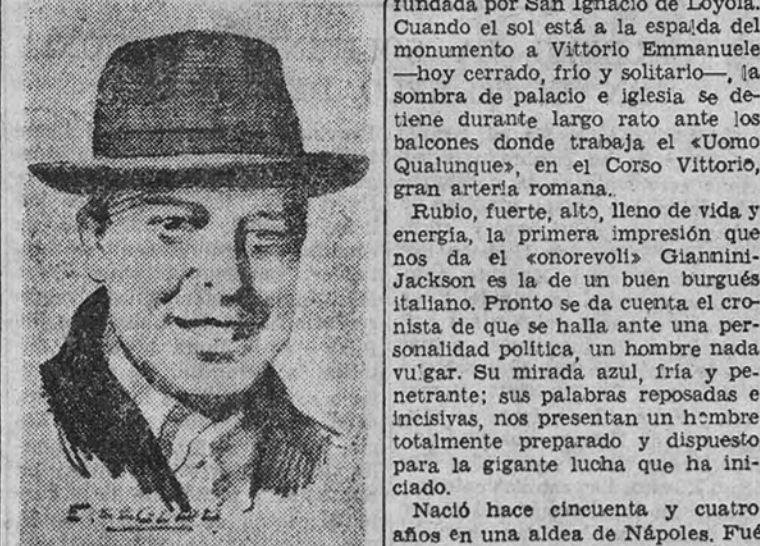
Guglielmo Giannini ROMA. (Especial para ARRIBA). El histórico palacio de Venecia tiene adherida la vieja iglesia de Jesús, fundada por San Ignacio de Loyola. Cuando el sol está a la espalda del monumento a Vittorio Emanuele—hoy cerrado, frío y solitario—, la sombra de palacio e iglesia se detiene durante largo rato ante los balcones donde trabaja el "Uomo Qualunque", en el Corso Vittorio, gran arteria romana.