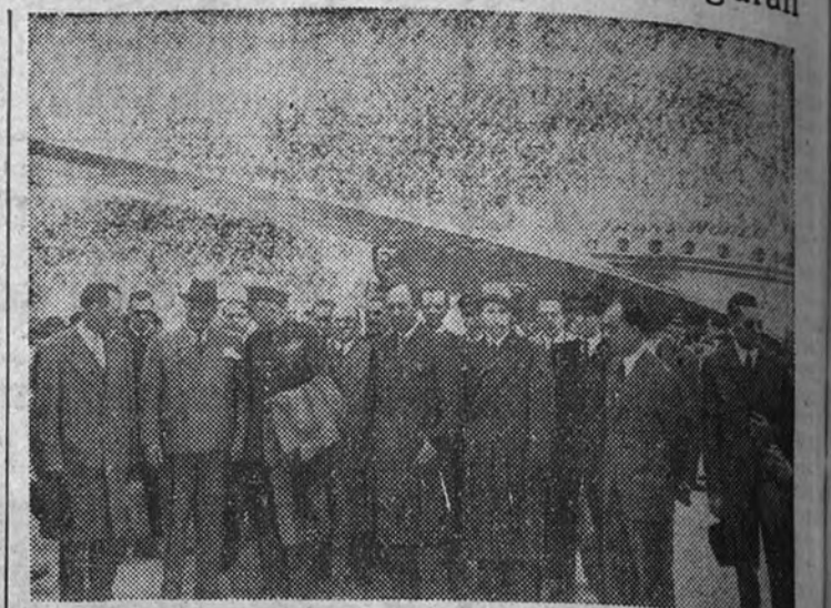
Personalidades que asistieron en el aeropuerto transoceánico de Barajas a la llegada de uno de los grandes aviones que inauguran una nueva línea aérea

MONUMENTAL CINEMA.—Continúa 6: Es peligroso asomarse al exterior y La monja afeitada.