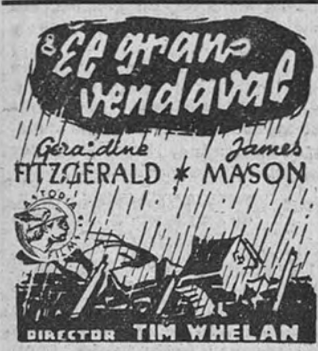
El gran vendaval, de la marca Rey Soria Films