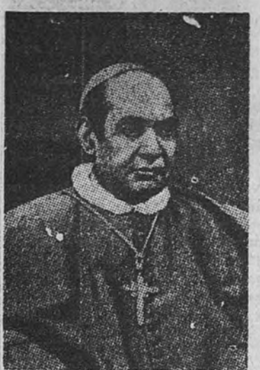
Beato Juan María Claret

En España se celebra esta fiesta con todo esplendor ya en